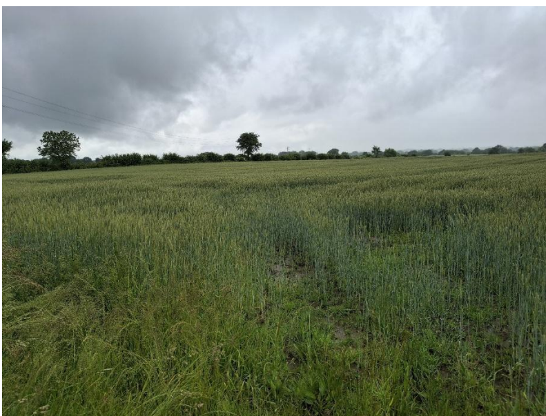
Abb. 2.1 Blick auf das Vorhabengebiet von Nordosten nach Süden.

Am 08.06.2025 fand eine Begehung des Vorhabengebietes für die Habitatpotenzialanalyse bezüglich aller relevanten FFH Anhang IV Arten statt. Die Vorhabenfläche wird ackerbaulich genutzt und ist zum Zeitpunkt der Ortsbegehung mit Getreide bestellt (Abb. 2.1). Die südliche und nördliche Grenze des Vorhabengebietes sind größtenteils durch Knickstrukturen von den anschließenden Feldern abgegrenzt (Abb. 2.2). Im Osten des Vorhabengebietes grenzt ein Grünstreifen mit Gehölzen die Fläche von der Straße L 309 ab (Abb. 2.3 links). Im Westen gibt es ebenfalls Gehölze vor der Bahnlinie (Abb. 2.3 rechts). Daran schließen ein Gehölzstreifen und ein Feldweg an (Abb. 2.4 links), hinter dem ein kleines Waldstück, ein Grünland und zwei kleine Gewässer liegen (Abb. 2.4 rechts).