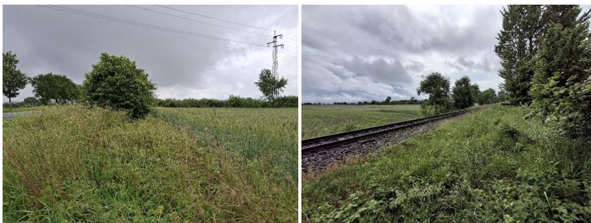
Abb. 2.3 Links: Grünstreifen mit Gehölzen an der östlichen Grenze des Vorhabengebietes (Blick von N nach S); Rechts: Gehölzstrukturen an der westlichen Grenze des Vorhabengebietes (Blick von NW nach S).