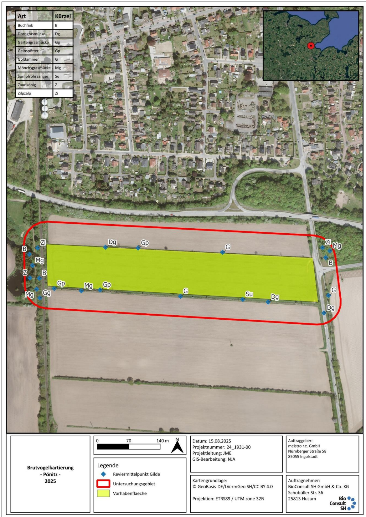
Abb. 3.1 Ergebnisse der Brutvogelkartierung 2025 im Vorhabengebiet sowie im Untersuchungsbereich (50 m Puffer), zur Errichtung einer PV-Anlage mit Batteriespeicher in Pönitz/Scharbeutz.