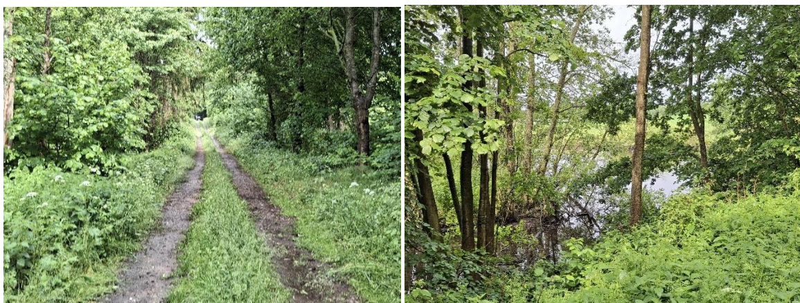
Abb. 2.4 Links: Ladeweg westlich der Vorhabenfläche und der Bahnlinie; Rechts: Gewässer westlich angrenzend an Ladeweg.