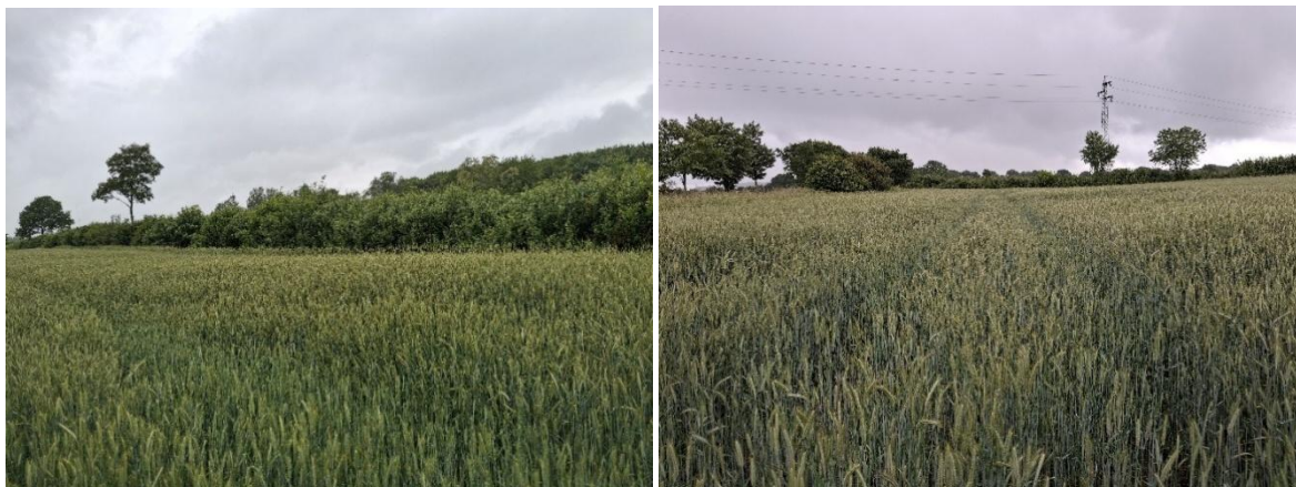
Abb. 2.2 Blick auf die Knickstruktur an der nördlichen (links) und südlichen Grenze (rechts) des Vorhabengebietes im Außenbereich der Gemeinde Scharbeutz, Ortsteil Pönitz.