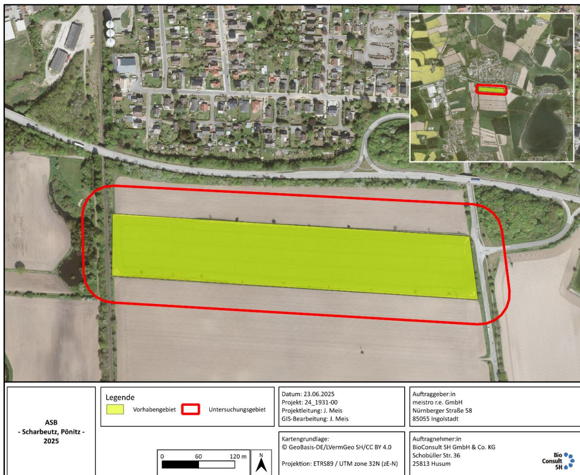
Abb. 1.1: Übersicht über das Vorhabensgebiet und das Untersuchungsgebiet (50 m Pufferbereich) der geplanten PV-Anlage mit Energiespeicher in der Gemeinde Scharbeutz, Ortsteil Pönitz, Kreis Ostholstein.

Die Gemeinde Scharbeutz beabsichtigt im Rahmen des vorhabenbezogenen Bebauungsplan Nr. 109 und der Festsetzung eines Sondergebietes „Photovoltaikanlagen“, auf einer Fläche von ca. 5,7 ha im Außenbereich des Ortsteil Pönitz freistehende Solarmodule (PV-Anlage) und einen Energiespeicher zu errichten (Abb. 1.1).