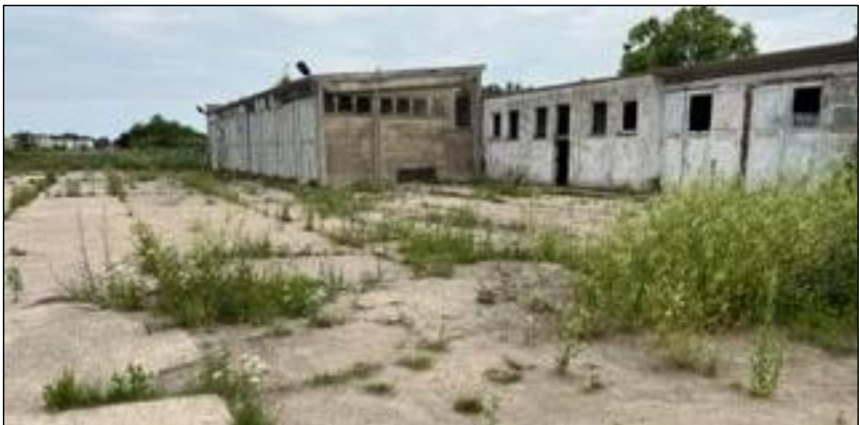
Abbildung 3: Bild vom Planungsraum mit Bestandsgebäude (Juli 2022)

Aktuell befindet sich ein ehemaliger Garagenkomplex auf dem Gelände, der schon teilweise abgebrochen wurde. Das Gebäude ist in einem sehr schlechten Zustand und soll im Zuge der Baumaßnahmen abgerissen werden. Des Weiteren ist ein Großteil der Fläche überwiegend mit Betonplatten versiegelt.