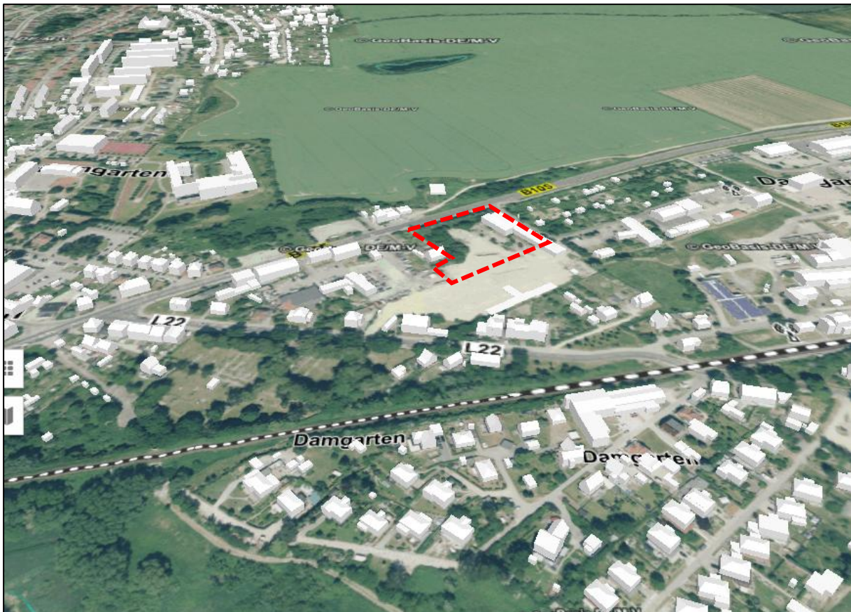
Abbildung 1: Ausschnitt aus der VirtualCityMAP 3D Stadtmodelle (Planungsraum rot skizziert)

Ebenso befinden sich im Planungsraum keine nationalen oder europäischen Schutzgebiete. Bei den nächstgelegenen europäischen Schutzgebieten handelt es sich um das Europäische Vogelschutzgebiet DE 1941-401 „Recknitz- und Trebeltal mit Seitentälern und Feldmark“, welches sich südlich in einer Entfernung von ca. 270 m erstreckt, und dem Gebiet von gemeinschaftlicher Bedeutung (GGB) DE 1941-301 „Recknitz- und Trebeltal mit Zuflüssen“, welches sich ebenfalls südlich in einer Entfernung von ca. 280 m erstreckt.