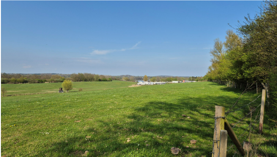
Abb. 3: Grünlandfläche, geplantes Sondergebiet Camping, 2025