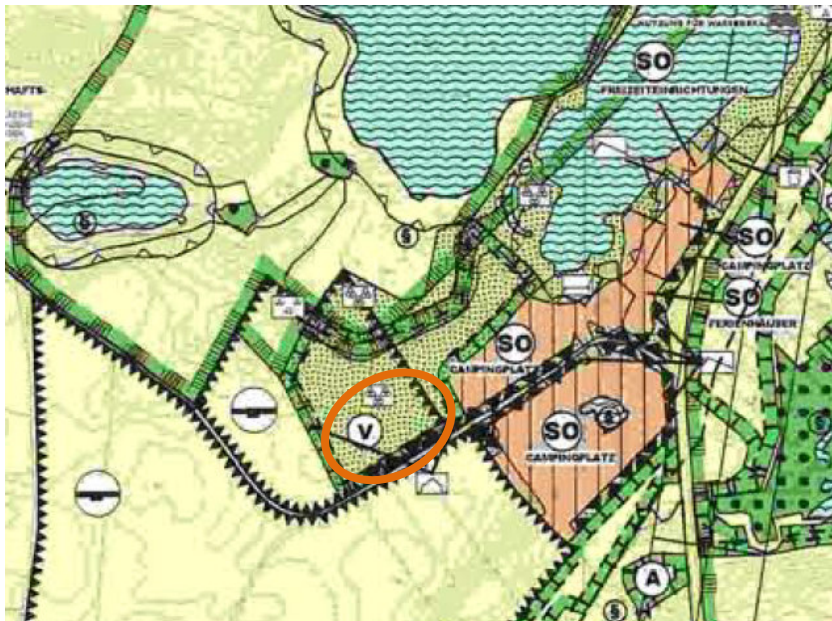
Abb. 1: Ausschnitt aus dem Flächennutzungsplan der Gemeinde Süsel mit Lage der 15. Änderung

Der von der 15. Änderung des F-Plans betroffene Teil des Gemeindegebiets schließt an die im F-Plan ausgewiesenen Sondergebiete „Campingplatz“ an. Aktuell sind die für die 15. F-Plan-Änderung vorgesehenen Flächen als Grünfläche „extensives Grünland“ ausgewiesen, die zugleich eine Vorrangfläche für den Naturschutz ist.