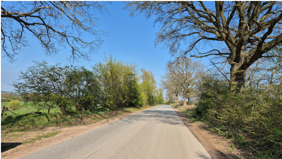
Abb. 4: Erschließung über die Straße Holmkamp