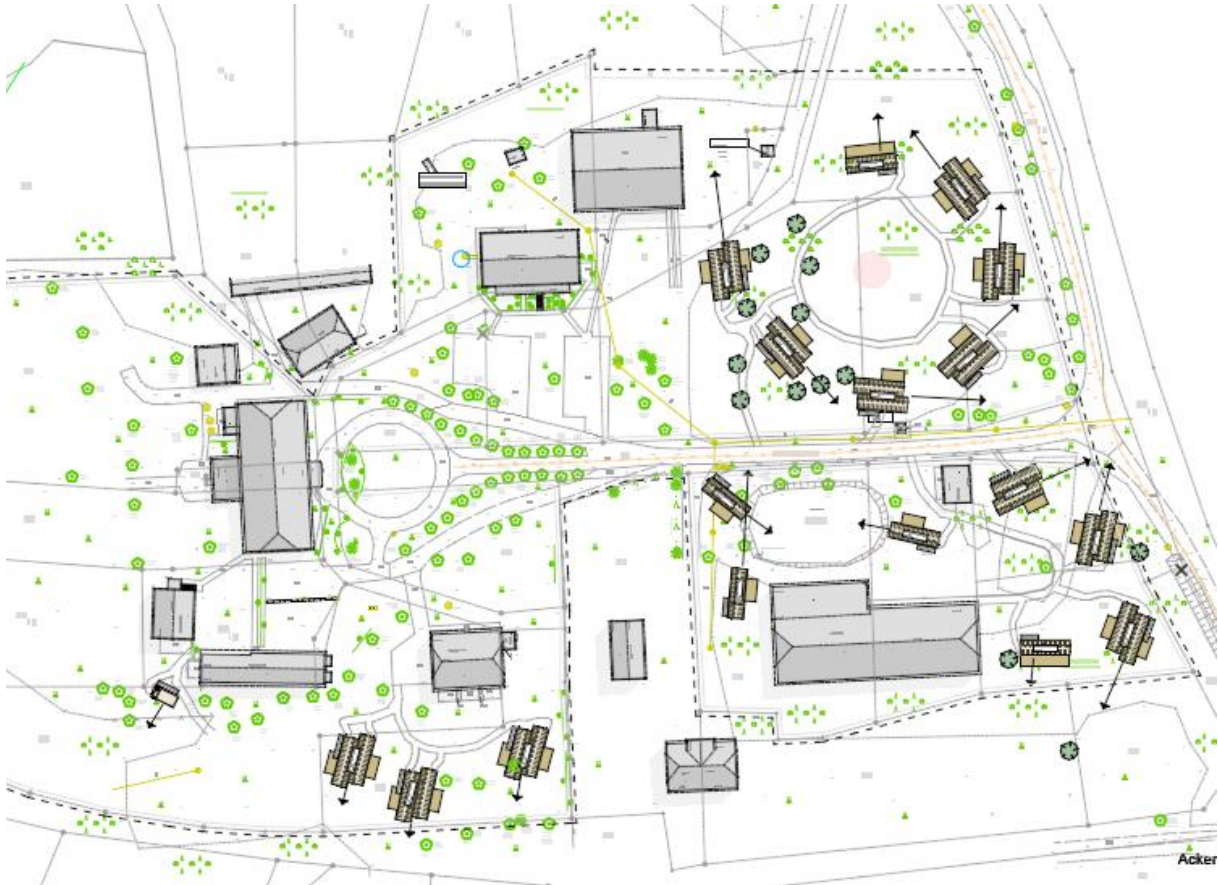
Abbildung 1 Lageplan Lieblingsplatz Bohlendorf

Die Lieblingsplatz Grundbesitz GmbH & Co. KG plant die Erweiterung des Hotel Lieblingsplatz in Bohlendorf auf Rügen. Gemäß der Planung sollen dort mehrere naturnahe Ferienappartements entstehen. Die Lage der Appartements können der Abbildung 1 entnommen werden. Das geplante Bauvorhaben wird über die bestehende Einfahrt zum Hotel Lieblingsplatz erschlossen.