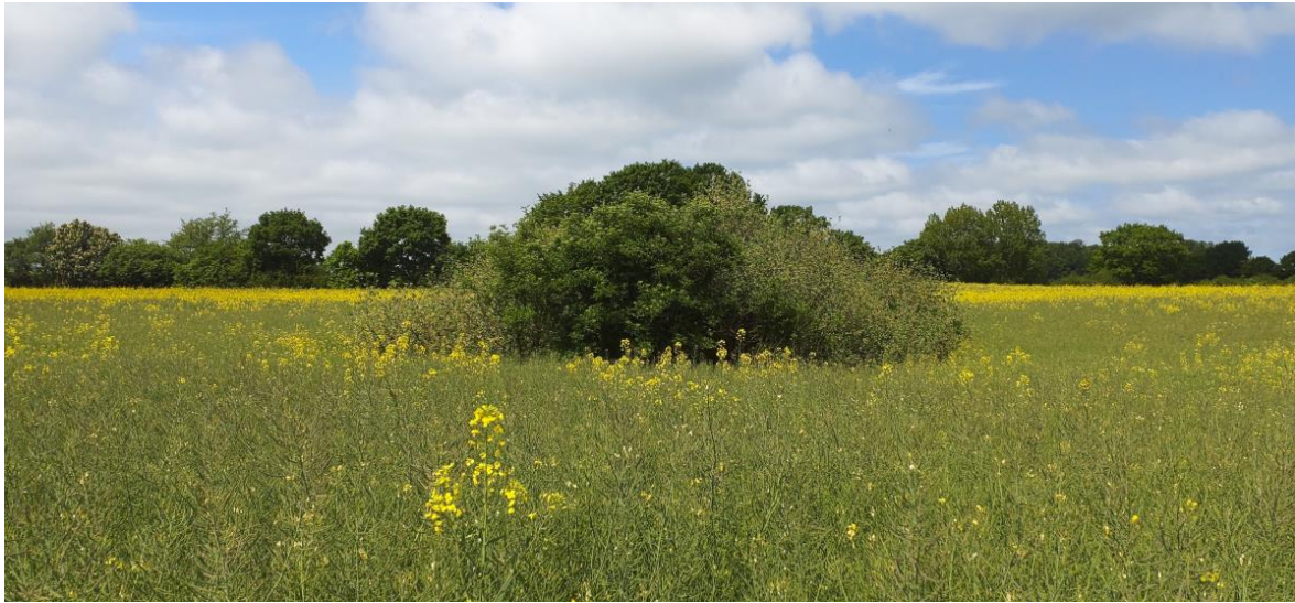
Abb. 4 Übersicht über das Feldgehölz im nördlichen Bereich der Vorhabenfläche, Blick von Süd nach Nord (Foto: B. Förster, 30. Mai 2023).

Der Standort besitzt potenzielle Lebensräume für Brutvögel innerhalb des gesamten Untersuchungsgebietes. Dies betrifft insbesondere die Gilden ‚Brutvögel des Offenlandes‘ und ‚Brutvögel der Gehölze‘. Durch die angrenzenden Baumbestände besteht außerdem eine potenzielle Eignung für Groß- und Greifvögel.