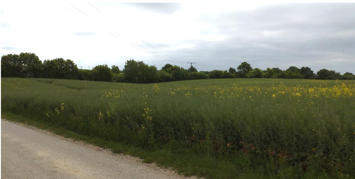
Abb. 3 Übersicht über den südlichen Bereich der Vorhabenfläche mit der Freileitung und dem Wirtschaftsweg am östlichen Rand der Fläche, Blick von Osten nach Süden (Foto: B. Förster, 30. Mai 2023).