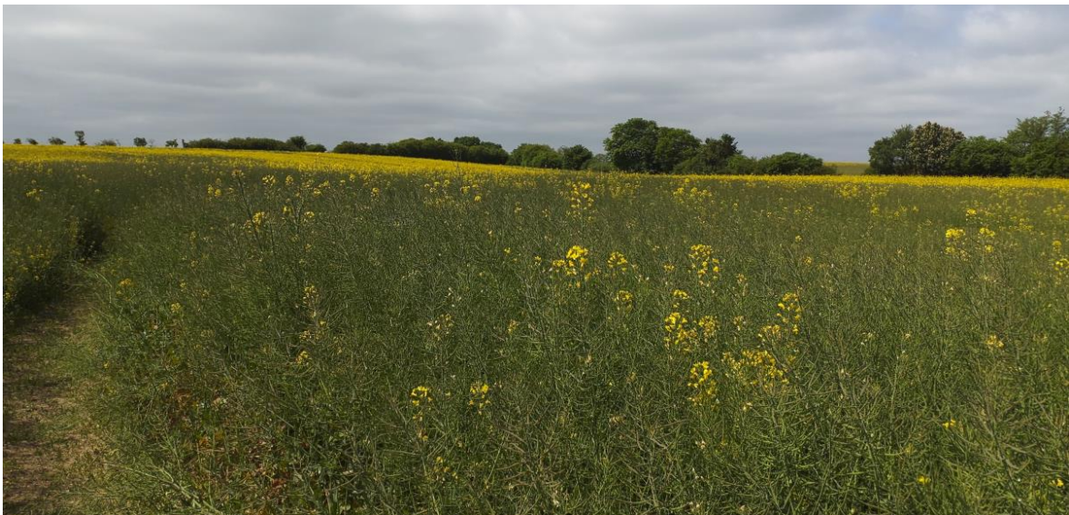
Abb. 2 Übersicht über den nördlichen Bereich der Vorhabenfläche mit den umliegenden linearen Gehölzstrukturen, Blick von Osten nach Nordwesten. (Foto: B. Förster, 30. Mai 2023).

Im nördlichen Teil des Vorhabengebietes befindet sich ein Feldgehölz mit einer Ausdehnung von ca. 12 x 20 Metern, im südlichen Bereich liegen zwei kleine und eine etwas größere Senke (s. Abb. 5). Im Untersuchungsjahr (2023) wurde auf den Flächen des Vorhabengebietes „Brauner Hirsch“ Raps angebaut (s. Abb. 2 bis Abb. 4).