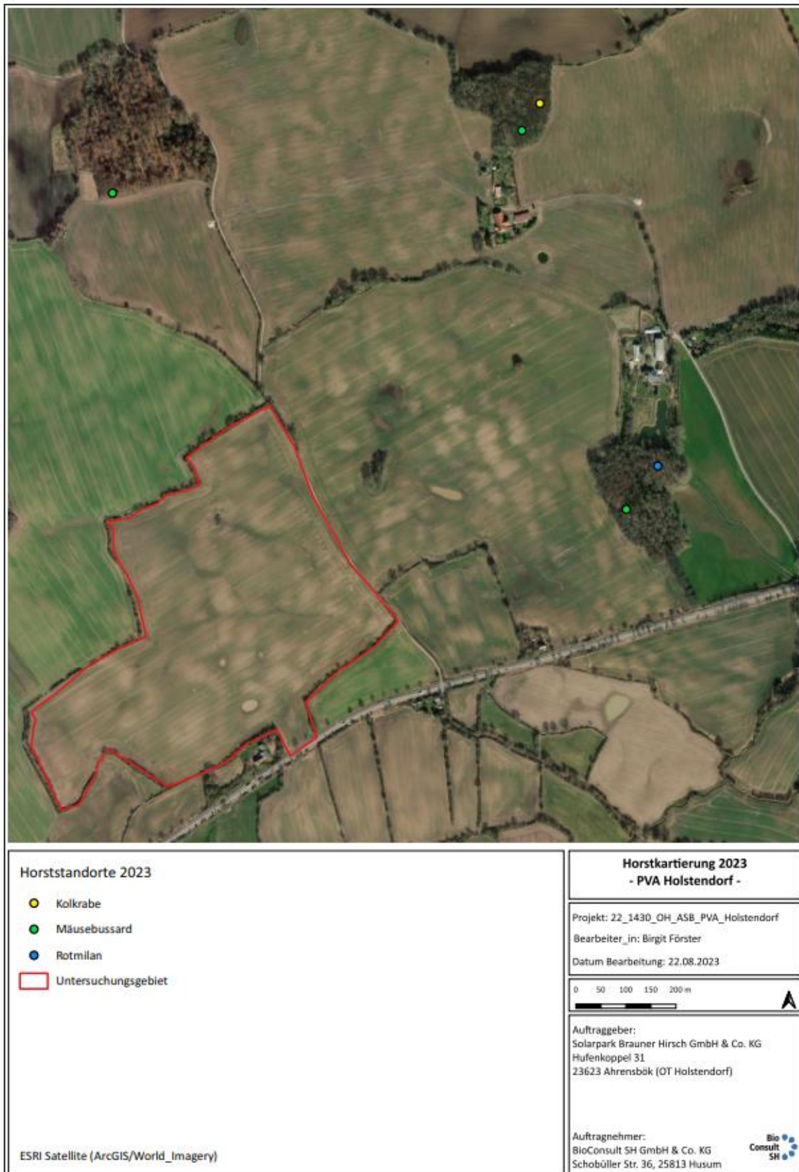
Abb. 6 Darstellung der im Jahr 2023 ermittelten Neststandorte von Groß- und Greifvögeln im Untersuchungsgebiet der geplanten PVA „Brauner Hirsch“, Holstendorf.