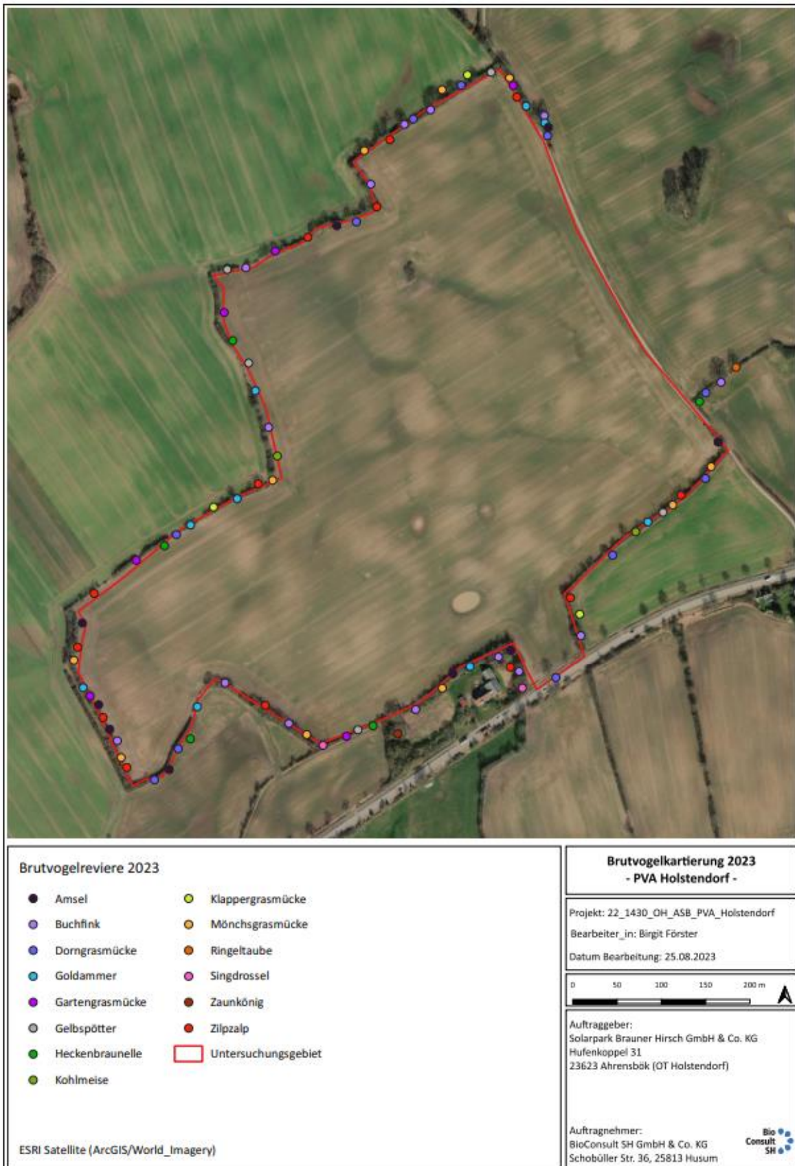
Abb. 5 Darstellung der im Jahr 2023 ermittelten Brutvogelreviere im Untersuchungsgebiet der geplanten PVA „Brauner Hirsch“, Holstendorf.