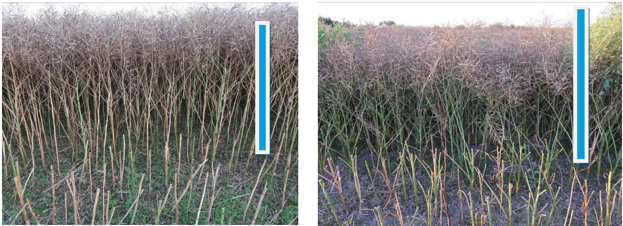
Abbildung 2: Unterschiedliche Formen von Raps – links: normale Form, rechts: kleinwüchsige Form (Balken ca. 1,5 m)

Die Ursachen für die Beobachtung von „Leerrevieren“ können sehr unterschiedlich sein. In Behrenshagen könnte ein möglicher Faktor der Anbau einer sehr kleinwüchsigen Rapsform mit einer Höhe zwischen 1,0 m und 1,3 m statt der klassischen Form mit Höhen von 1,20 m bis 1,70 m oder höher. Auffällig war, dass die kleinwüchsige Rapsform bereits sehr früh im Jahr den vollständigen Bestandsschluss erreichte. Selbst die Leitspuren werden schnell und vollständig überwachsen, so dass ein Eindringen der Feldlerche in die Vegetationsstruktur deutlich erschwert wurde. Bei der Ernte konnten die Wuchsunterschiede zwischen der klassischen Rapsform und der kleinwüchsigen Form beobachtet werden. Bei der klassischen Rapsform beginnt die Verzweigung erst in einiger Höhe über dem Boden. Es bildet sich ein bodennahes Gewölbe, welches zumindest theoretisch durch die Feldlerche nutzbar ist. Bei der kleinwüchsigen Rapsform beginnt die Verzweigung bereits am Stängelgrund, kurz über dem Boden. Es ist keinerlei Bewegungsmöglichkeit für die Feldlerche im bodennahen Raum vorhanden.