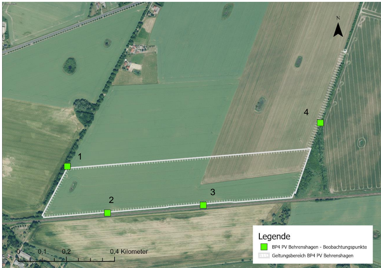
Abbildung 1: Untersuchungsraum und Untersuchungspunkte