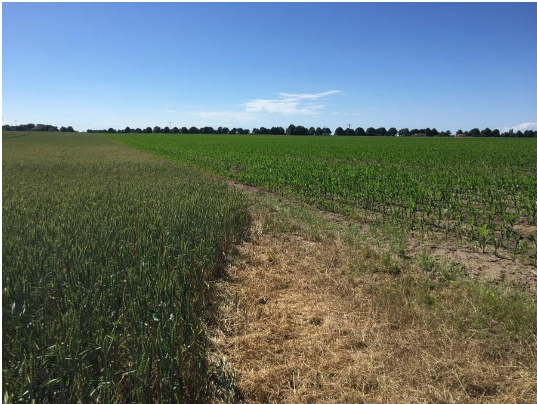
Abb.10: Wirtschaftsweg als Anbindungspunkt für Planstraße A, Blick nach Nord