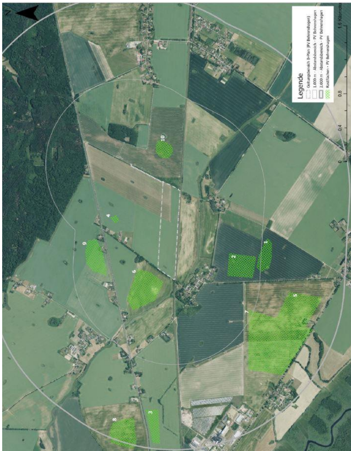
Abb. 6: Rastgeschehen im Untersuchungsraum (NATUR UND MEER 05/2023)

Den Rastflächen werden nachfolgend die beobachteten Vogelarten und ihre Anzahl zur Beobachtungszeit zugeordnet: