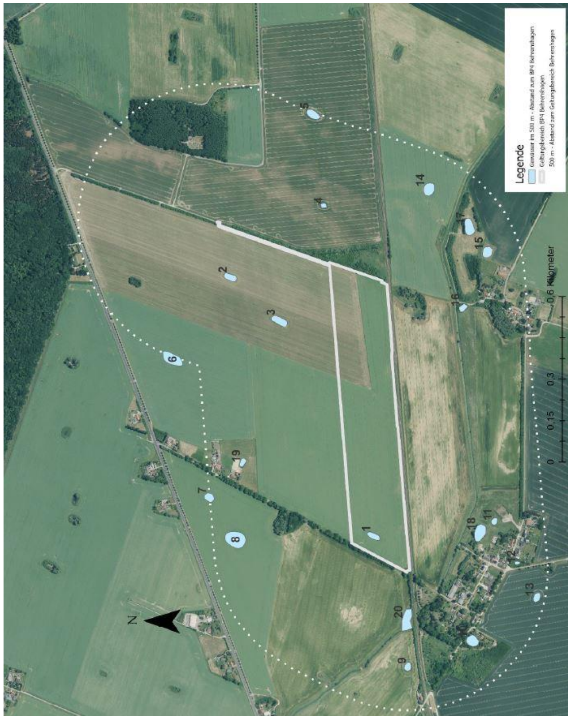
Abb. 2: Gewässer im Planungsumfeld (NATUR UND MEER 2022)

Im Kleingewässer im Plangebiet konnten durch den Gutachter einige wenige Individuen des Teichfrosches bzw. der Wasserfrosch-Artengruppe ( Pelophylax kl. esculentus ) festgestellt werden. Der Gutachter geht zudem davon aus, dass sich die Art im Kartierungsjahr nicht im Plangebiet reproduziert hat, da diese durch die spätere Reproduktionszeit keine ausreichenden Lebensbedingungen mehr vorgefunden hat. Bei der sommerlichen Nachsuche wurden jedoch keinen Amphibien mehr im Plangebiet festgestellt. Mit obiger Annahme, dass der Kleine Wasserfrosch ( Pelophylax lessonae ) verbreitungsbedingt ausgeschlossen ist, wäre auch bei erfolgtem Reproduktionsnachweis der kartierten Wasserfrösche, im Sinne der artenschutzrechtlichen Bestimmungen des § 44 BNatSchG keine Relevanz gegeben, da die