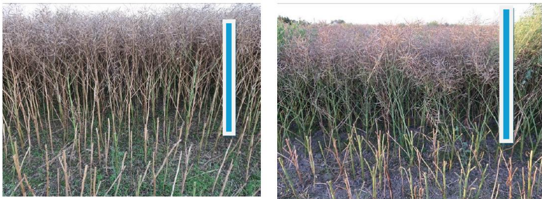
Abb. 5: Unterschiedliche Formen von Raps – links: normale Form, rechts: kleinwüchsige Form (Balken ca. 1,5 m) (NATUR UND MEER 08/2024)

Wie dargestellt zu sehen, ist der bodennahe Raum für die Feldlerche nicht nutzbar. Mit zwei Kartierungsjahren (für Brutvögel bzw. das Brutgeschehen der Feldlerche) und insgesamt 15 Begehungen wurden deutlich mehr Begehungen als die 8 in der HzE 2018 (Stand 2019) für Brutvogel geforderten durchgeführt. In den beiden Kartierungsjahren wurden dabei zwei genau entgegengesetzte Extreme bezüglich der Feldlerchenrevieranzahl erfasst. Ausgehend von den Kartiierungsergebnisse kann bei einem Jahr mit durchschnittlichen Bedingungen für die Feldlerche von einer Revieranzahl für das Plangebiet etwa entsprechend obig abgeleiteten Zielwert für das Ergebnis des Monitorings ausgegangen werden – dementsprechend von 3 Revieren, was obige Herleitung des Gutachters validiert.