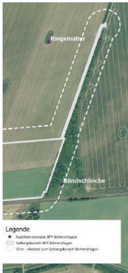
Abb. 3: Reptiliennachweise im Planungsumfeld (NATUR UND MEER 2022)

Für artenschutzrechtlich relevante Reptilienarten kommt es durch die Aufstellung des B-Plans Nr. 4 sowie der Umsetzung der Planinhalte nicht zum Verlust von relevanten Lebensraumstrukturen oder maßgeblichen Habitatbestandteilen. Das Eintreten von artenschutzrechtlichen Verbotstatbeständen im Sinne des § 44 Abs. 1 Nr. 1-3 BNatSchG ist im Ergebnis der Begutachtung sicher auszuschließen.