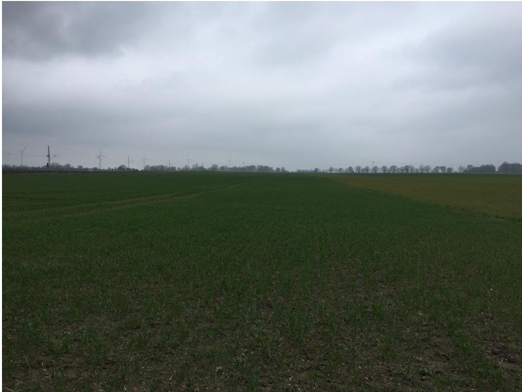
Abb.2: Feldgraskultur im April entlang des Feldgehölzes im östli. Geltungsbereich, Blick nach Süd