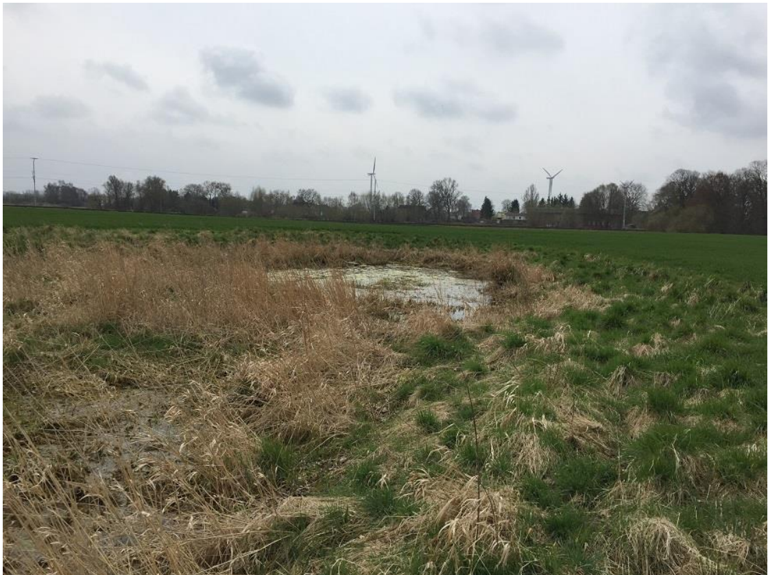
Abb.4: Zustand des Wasserkörpers des Kleingewässers im April