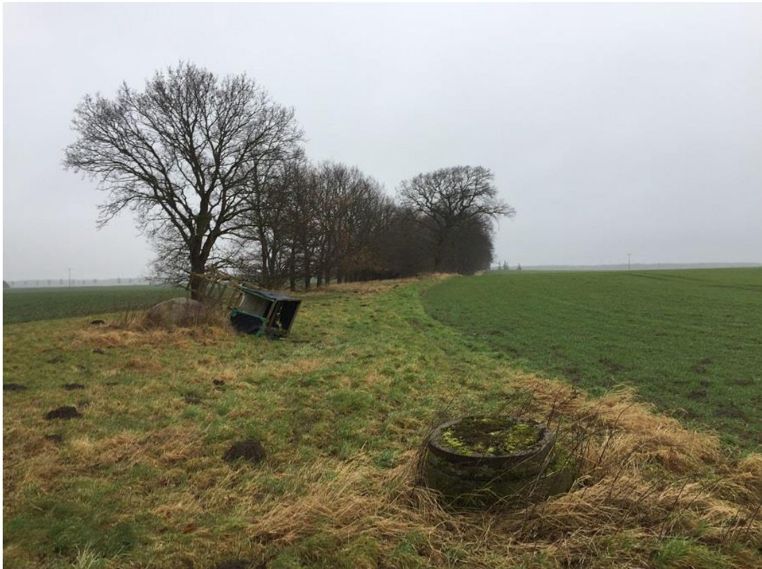
Abb.8: Allee westlich des Geltungsbereiches, Blick nach Nord