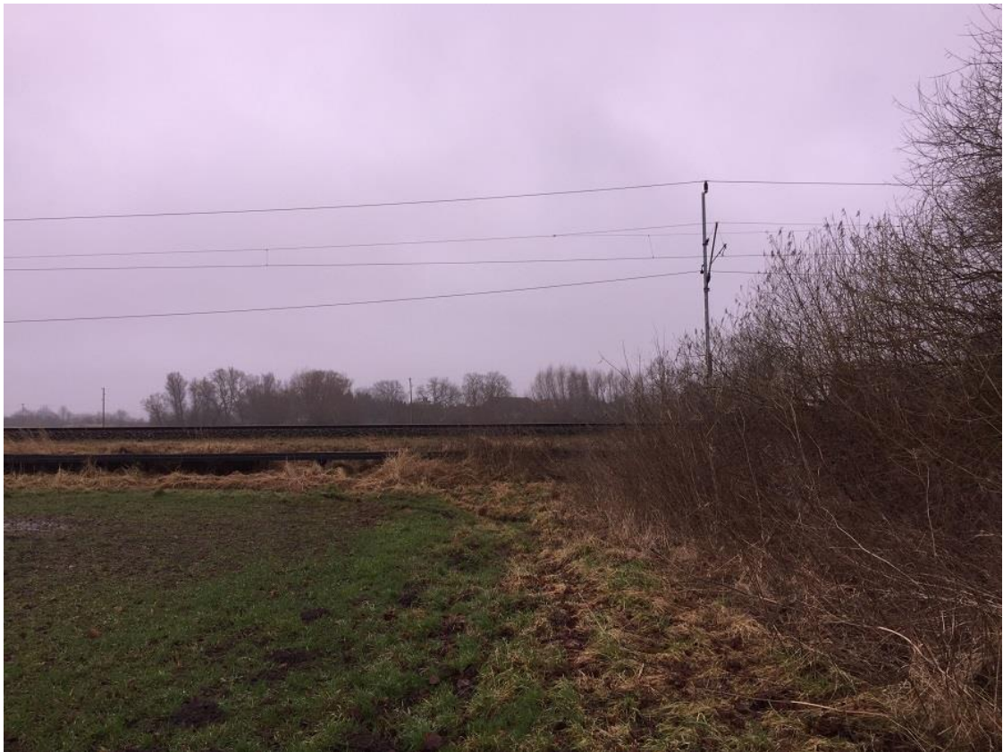
Abb.6: Bahngleise südlich des Geltungsbereiches im Januar, Blick nach Südost