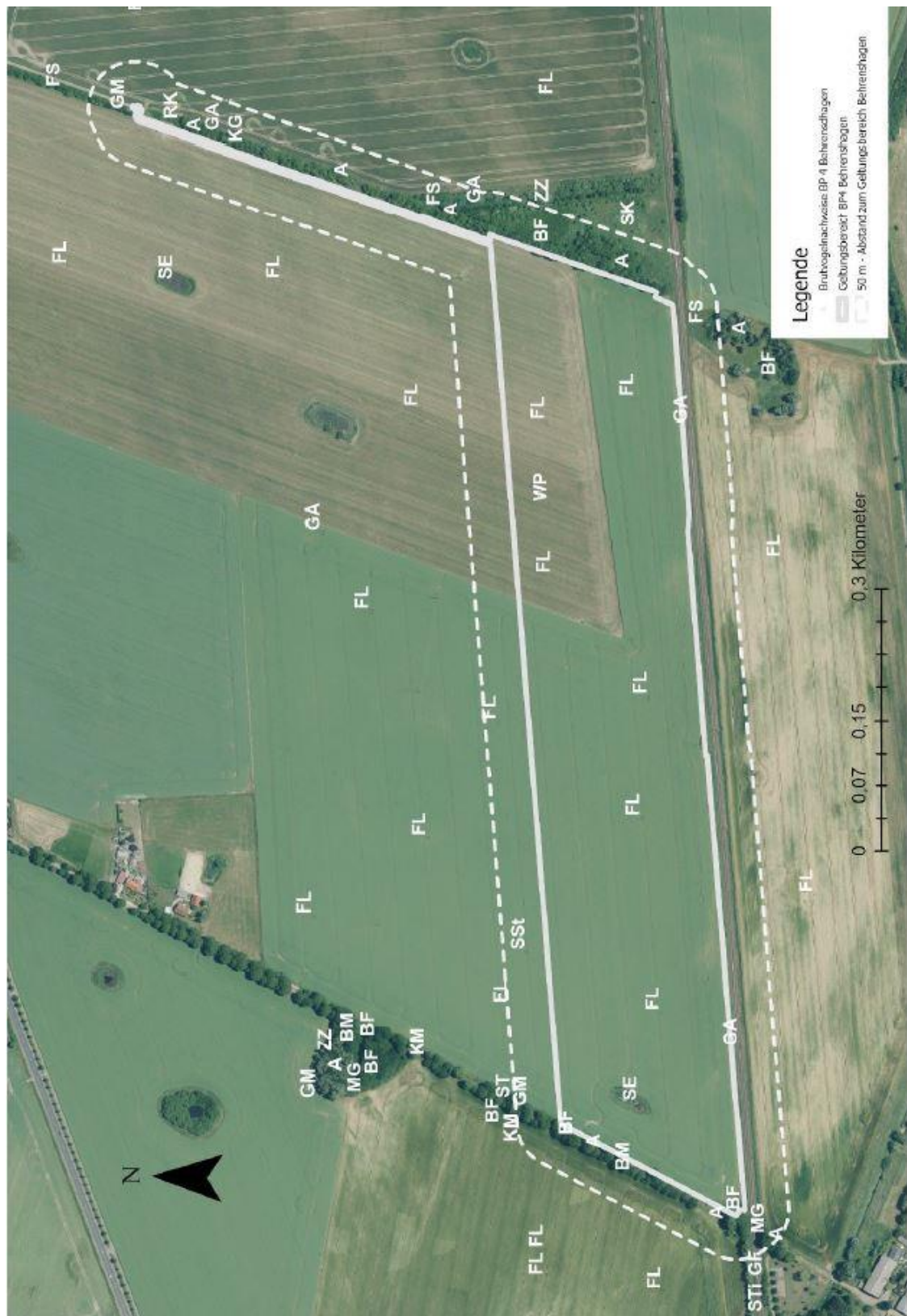
Abb. 4: Darstellung nachgewiesene Brutvogelvorkommen im Plangebiet und 50 m-Umfeld (natur und meer 7/2022), Abkürzungen siehe Tabelle 2

Wie in der Tabelle und der Abbildung zu dem Brutvogelvorkommen ersichtlich, konzentrieren sich die Brutvogelreviere v. a. im Bereich der Gehölze. Mit Blaumeise und