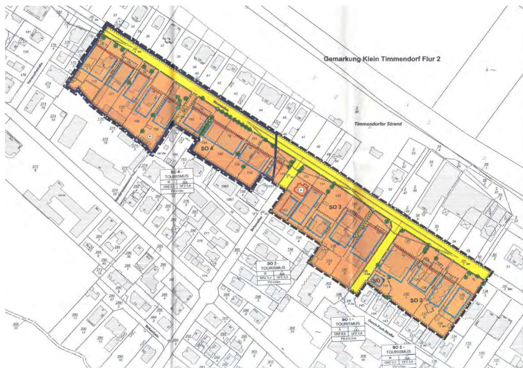
Bild 1: Auszug aus dem Bebauungsplan Nr. 19.1, gültig seit dem 23.03.2016

Seit dem 23.03.2016 gilt der Bebauungsplan Nr. 19.1 für den westlichen Bereich.