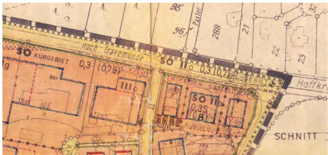
Bild 4: Auszug aus dem Bebauungsplan Nr. 4, gültig seit dem 30.04.1976

Diese setzt für das Plangebiet ebenfalls „Sonstige Sondergebiete“ nach § 11 BauNVO mit der Zweckbestimmung „Kurgebiet“ fest.