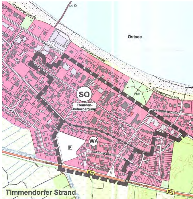
Bild 5: Auszug aus dem Bebauungsplan Nr. 4, 9. Änderung, gültig seit dem 22.12.2020

Alle vier Pläne lassen eine Zwei- bis Dreigeschossigkeit zu, offene Bauweisen, und Grundflächenzahlen zwischen 0,25 bis 0,35. Zudem sind die überbaubaren Grundstücksflächen engmaschig gesetzt. Daher ist das Ziel die wesentlichen Rahmenbedingungen für die Planungen zu vereinheitlichen und damit geringfügige bedarfsge-rechte Anpassungen in der Erhöhung der Grund- und Geschossflächenzahlen bzw. Gebäudehöhen zuzulassen.