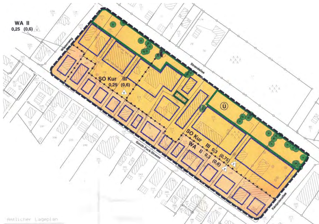
Bild 3: Auszug aus dem Bebauungsplan Nr. 4, 4. Änderung, gültig seit dem 22.01.2003

Für den Bereich östlich der Kastanienstraße gilt noch der Bebauungsplan Nr. 4 seit dem 30.04.1976.