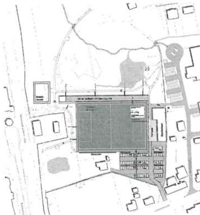
Abb.: Konzept (Ing.-Büro für Garten- und Landschaftsarchitektur, Knoll, Crons Kamp)

Die Detailplanung der Sport- und Freizeitanlagen erfolgt durch ein entsprechendes Fachbüro (Ing.-Büro für Garten- und Landschaftsarchitektur, Knoll, Crons Kamp).