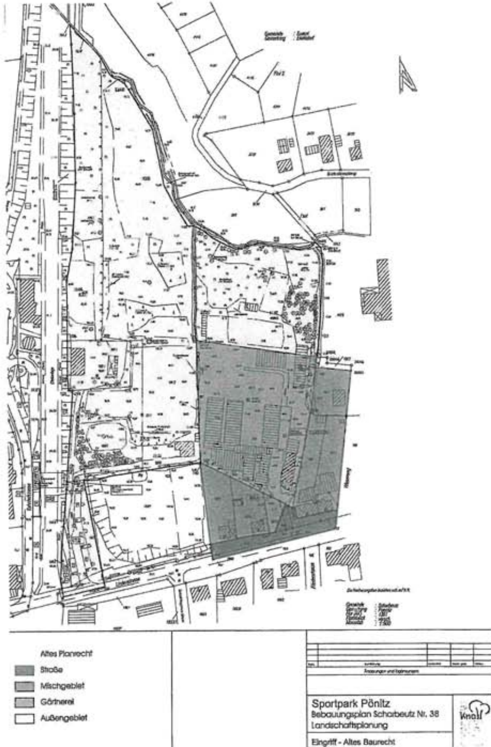
Abb.: Eingriff altes Baurecht (Ing.-Büro für Garten- und Landschaftsarchitektur, Knoll, Cronskamp)