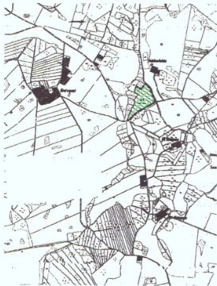
Übersicht, Maßstab 1:20.000