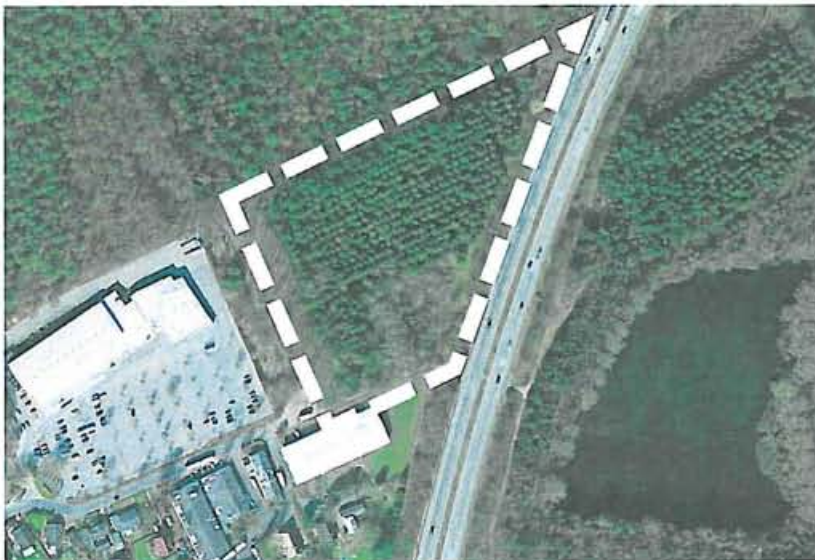
Abb.: Kreis Ostholstein internet Karte

Das Plangebiet liegt in der nordwestlichen Ortslage Sereetz, westlich der BAB A1 an der Straße „Sereetzer Feld“. Die Fläche präsentiert sich überwiegend gehölzbestanden (Laub- und Nadelbäume) und ist Wald nach Landeswaldgesetz. Das Gelände steigt in nordwestlicher Richtung leicht an.