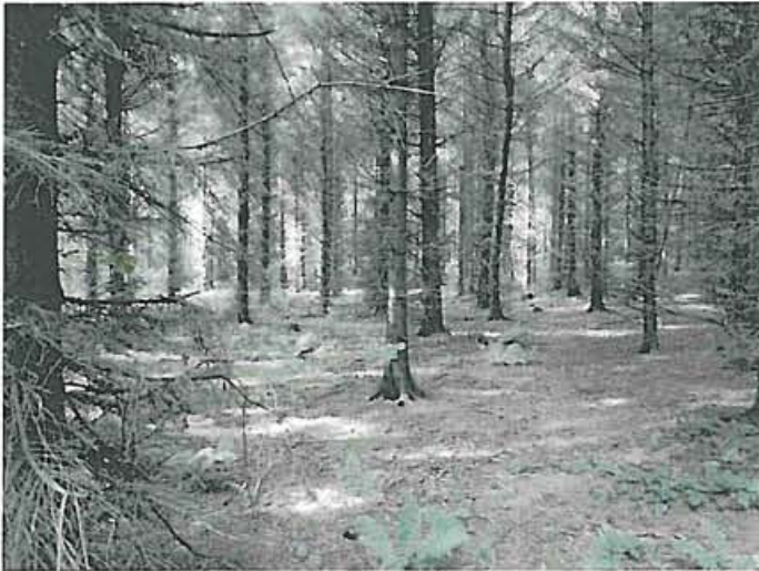
25.09.15. Fichtenforst

Die sich aus dem Vorhaben ergebenden Wirkfaktoren, die zu einer Erfüllung eines Verbotstatbestandes gemäß § 44 BNatSchG führen könnten, werden in nachfolgender Übersicht tabellarisch zusammengestellt.