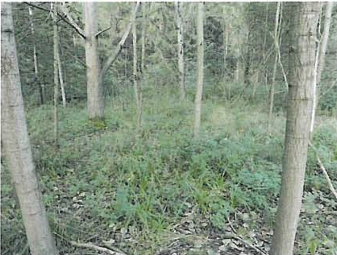
25.09.15. Pappelbestand, Aufforstung einer Senke