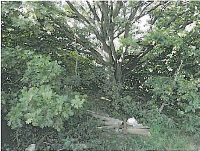
Einzelbaum am Wendeplatz