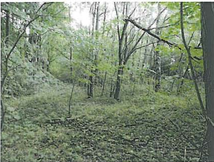
Ahornbestand im westlichen Bereich