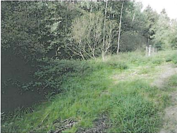
Foto O.Grell, 25.09.15. Feuchter Waldsaum unterhalb der Autobahnböschung