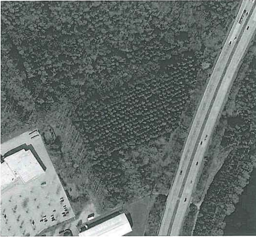
Abb. 2. Luftansicht Bestand des Geltungsbereiches des Bebauungsplans Nr. 94