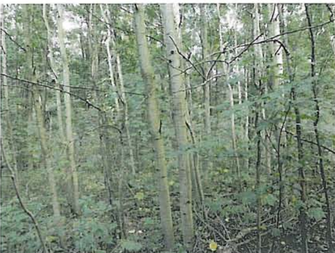
Zittelpappelbestand im westlichen Bereich