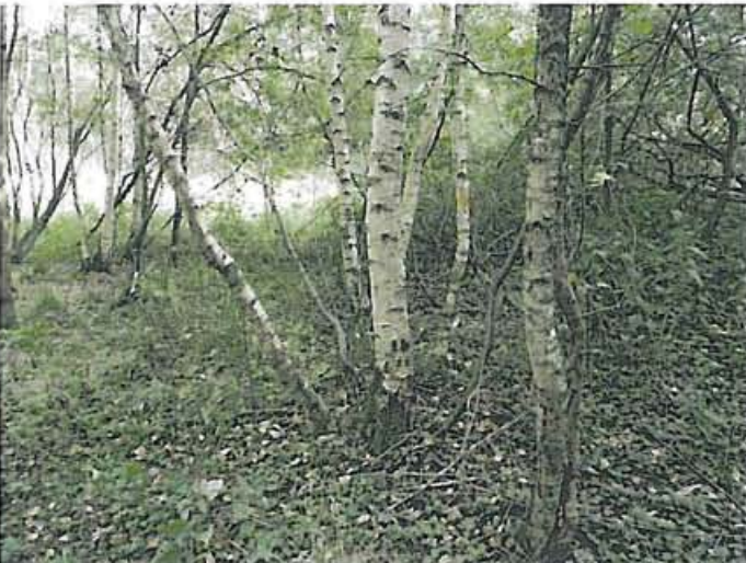
Foto O.Grell, 25.09.15. Restbestand Feuchtwald mit spontanem Bewuchs