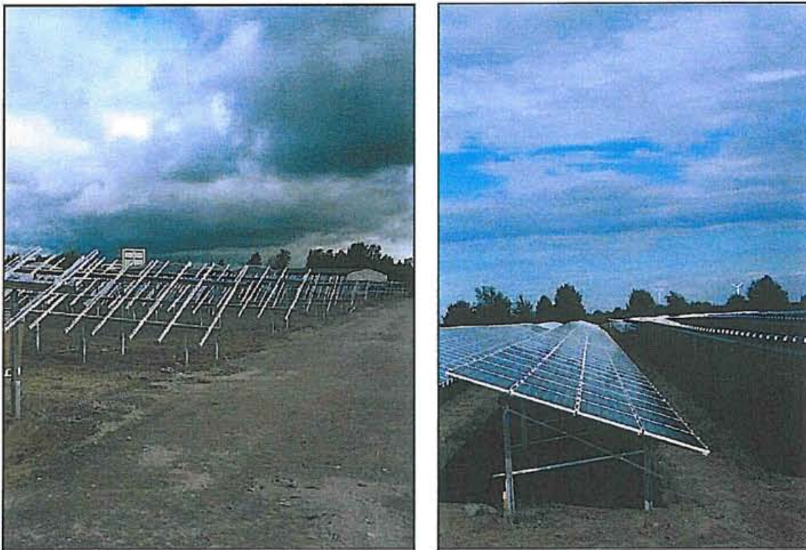
Abbildung 2 und 3: Detailansichten der vierreihigen Modultische

Im konkreten Fall ist es vorgesehen, die PV-Module fest auf Gestellen der Firma HDG-Solar GmbH, die aus Schienen- und Winkelsystemen bestehen, zu installieren (s. Abb. 2 und 3).