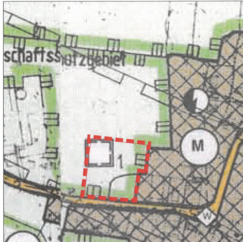
Ausschnitt aus dem wirksamen Flächennutzungsplan zur Information. Maßstab 1 : 3.000 Dieser Ausschnitt ist durch die 12. Änderung des Flächennutzungsplanes nicht mehr wirksam.