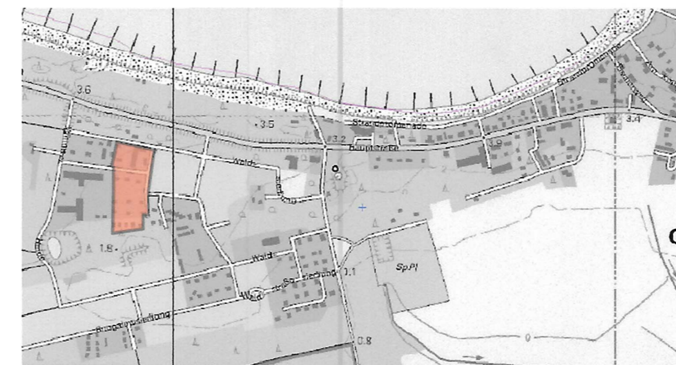
Übersichtsplan unmaßstäblich

Die 6. Änderung des Bebauungsplans tritt mit Ablauf des 18.07.2022 in Kraft.