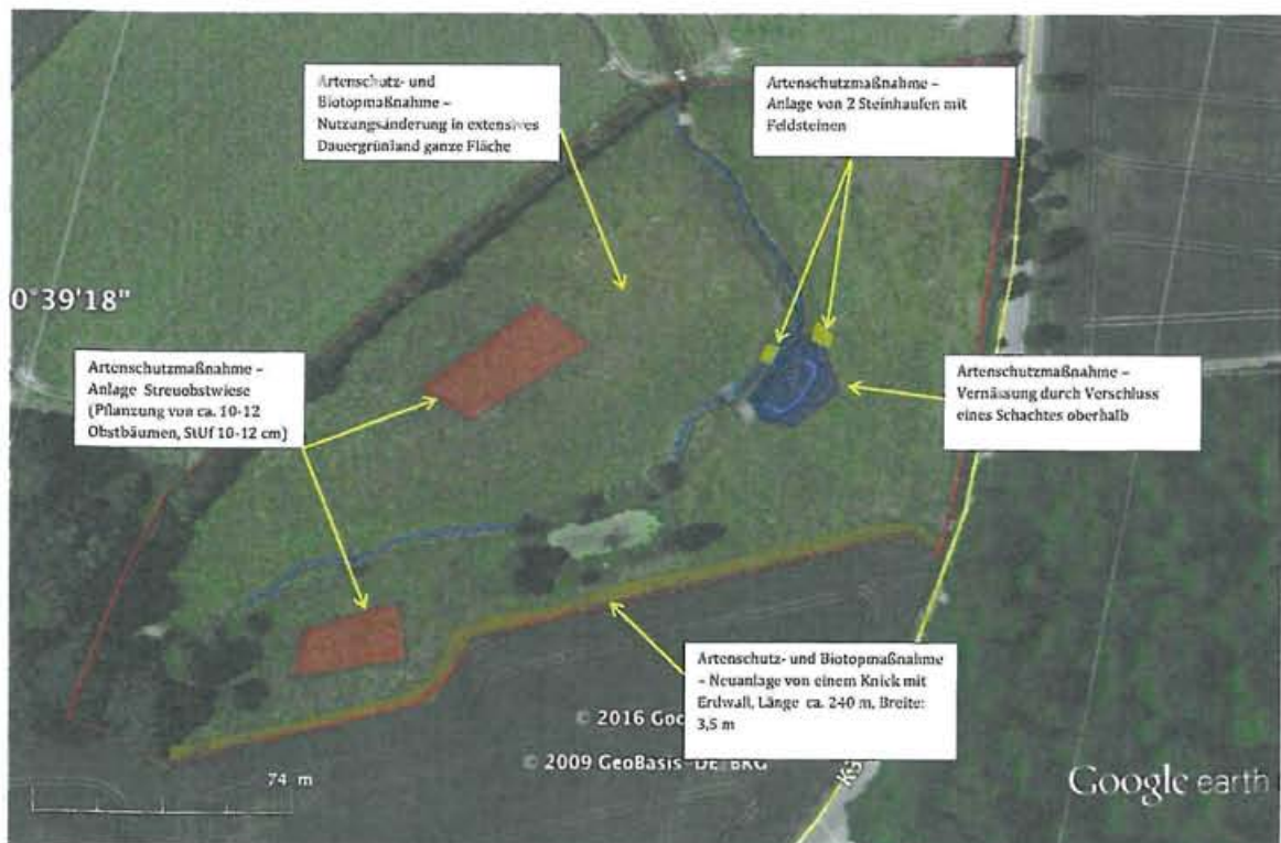
Maßnahmenkarte Ökokonto, Flurstück 302/5

Der insgesamt erforderliche Ausgleichsflächenbedarf für Gärtnerei und Wohnbebauung von zusammen 3.225 m 2 soll auf einer externen Ausgleichsfläche (Ökokonto) ca. 1 km südlich von Gleschendorf westlich der K 36 untergebracht werden. Der Ausgleich wird vertraglich gesichert.