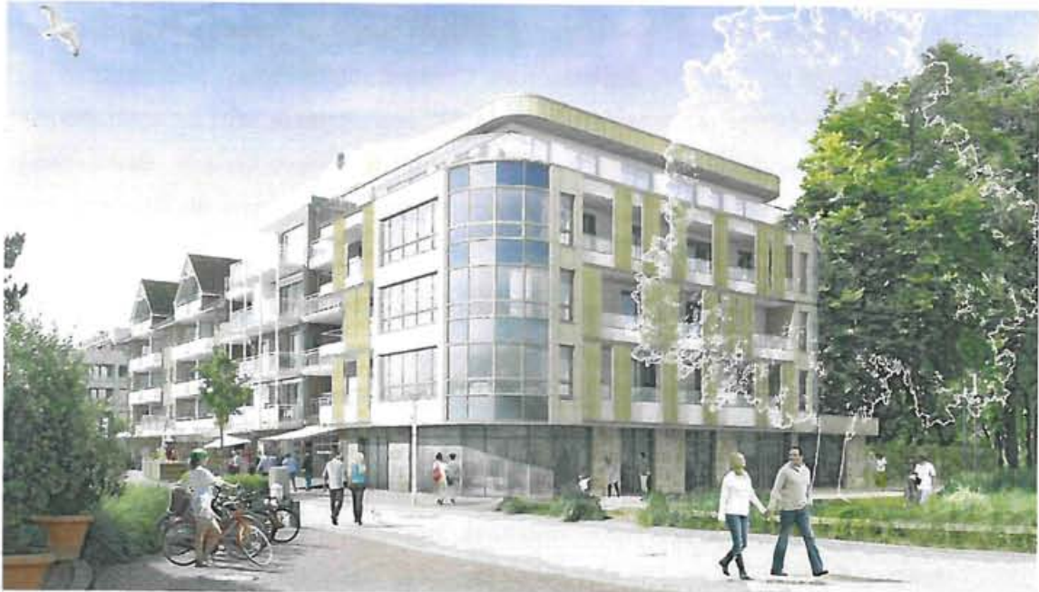
Abb.: Skizze Architekt Krancher

ung ist modern und fügt sich in die Gesamtbebauung am Seebrückenplatz (Bayside-Hotel) und der Ausformung von Strandallee und Seebrückenplatz mit den geschwungenen Linien ein.