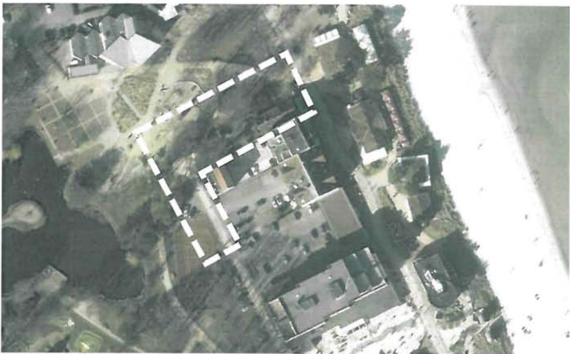
Abb.: Digitaler Atlas Nord (das Gebäude im Geltungsbereich wurde inzwischen abgerissen)

Das Plangebiet liegt in zentraler Ortslage Scharbeutz direkt an Strandallee und Kurpark und umfasst diverse Flurstücke der Flur 3 der Gemarkung Scharbeutz. Das Grundstück Strandallee 135 war mit einem nur zweigeschossigen Wohn- und Geschäftshaus bebaut, welches im Vorgriff auf die Neuplanung inzwischen rechtmäßig beseitigt wurde. Das Gelände fällt in westlicher Richtung leicht ab. Der nördliche Teil des Plangebietes umfasst den Kurpark. Dort ist ein WC-Gebäude vorhanden. Im Plangebiet befinden sich einzelne Laubbäume (Eichen, Bergahorn, Buchen). Südlich grenzt die mehrgeschossige Bebauung der Strandallee mit Wohn- und Geschäftshäusern und westlich der Bebauung angeordneten Stellplatzflächen an das Plangebiet an. Nördlich und westlich befindet sich der Kurpark. Im Osten liegt die Strandallee; dahinter die Promenade mit Versorgungsgebäuden und Gastronomie. Weiter östlich folgen Düne und der Ostseestrand.