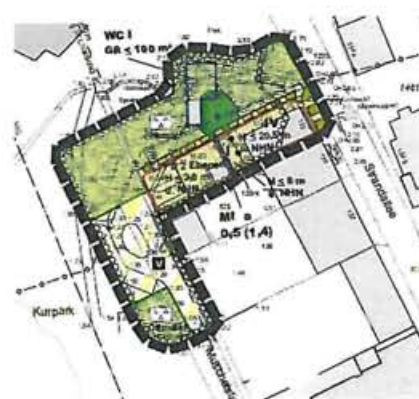
Auszug Entwurf B-Plan 41 Sch, 9. Änderung

Aufgrund der Lage im Ortsgefüge und der nahezu vollständig bereits bebauten Grundstücke wird mit dieser Bebauungsplanänderung eine Auswirkung auf den Klimawandel nicht