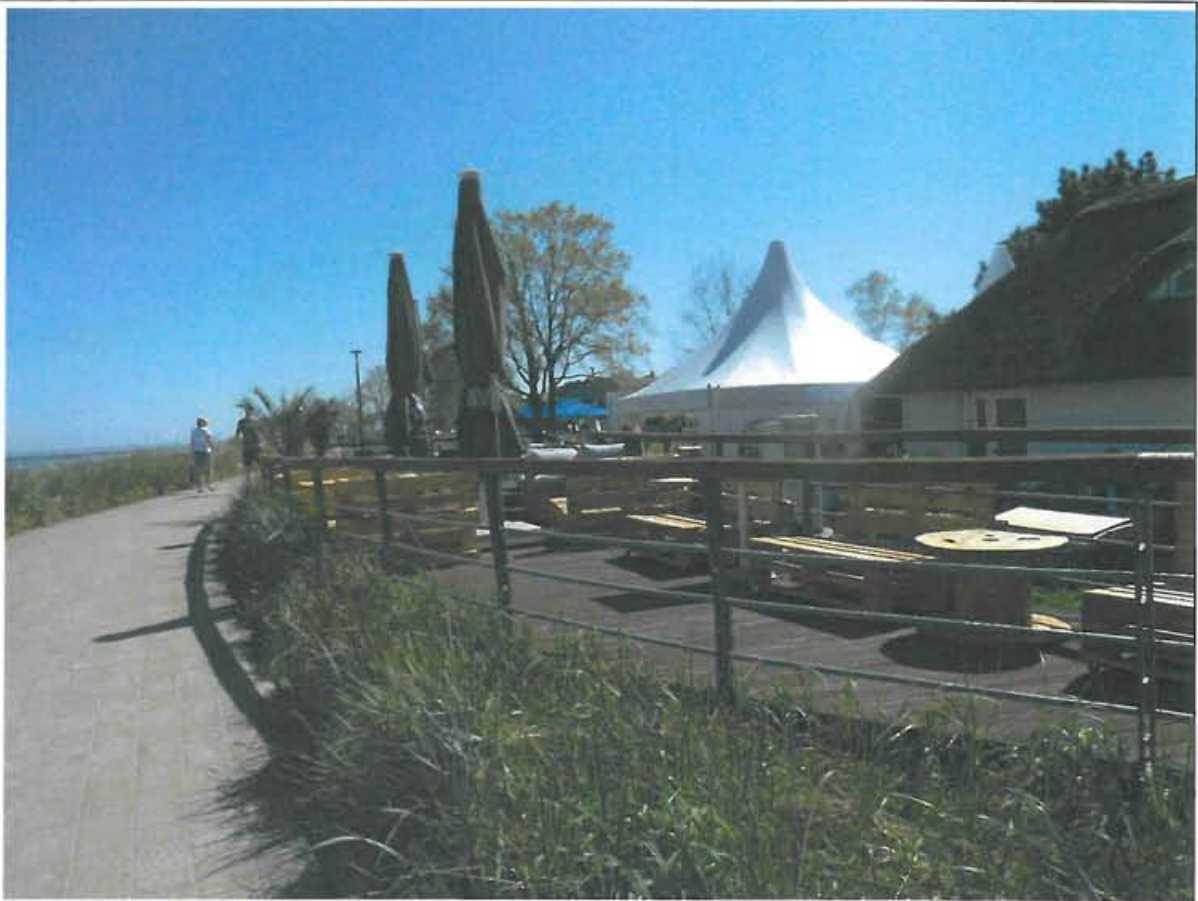
Abbildung 4: Standseitiger Blick auf das PG mit flankierendem Fahrrad- und Fußweg und Terrasse