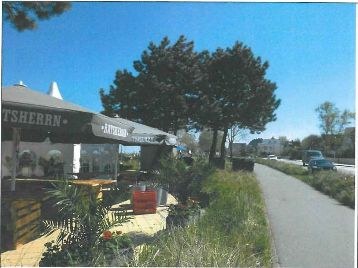
Abbildung 2: Zwischen Minigolfanlage und dem Plangebiet stehen zwei kleinere mehrstämmige Kiefern. Am rechten Bildrand verläuft die Strandallee mit begleitendem Fuß-/Radweg.