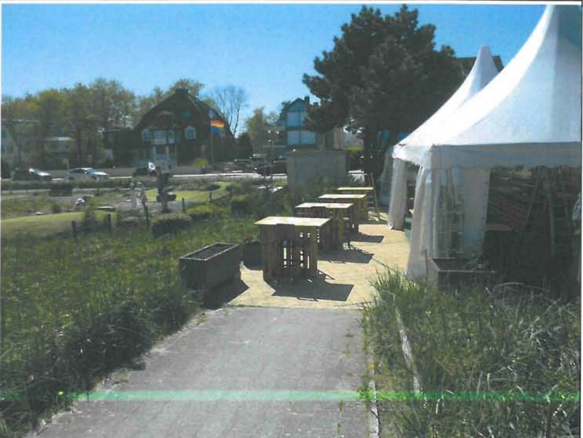
Abbildung 5: Freisitze und Partyzelte am Nordrand des Plangebiets im Übergang zum benachbarten Minigolfplatz. Die Kleingebüsche besitzen keinerlei Brutplatzzeichnung.