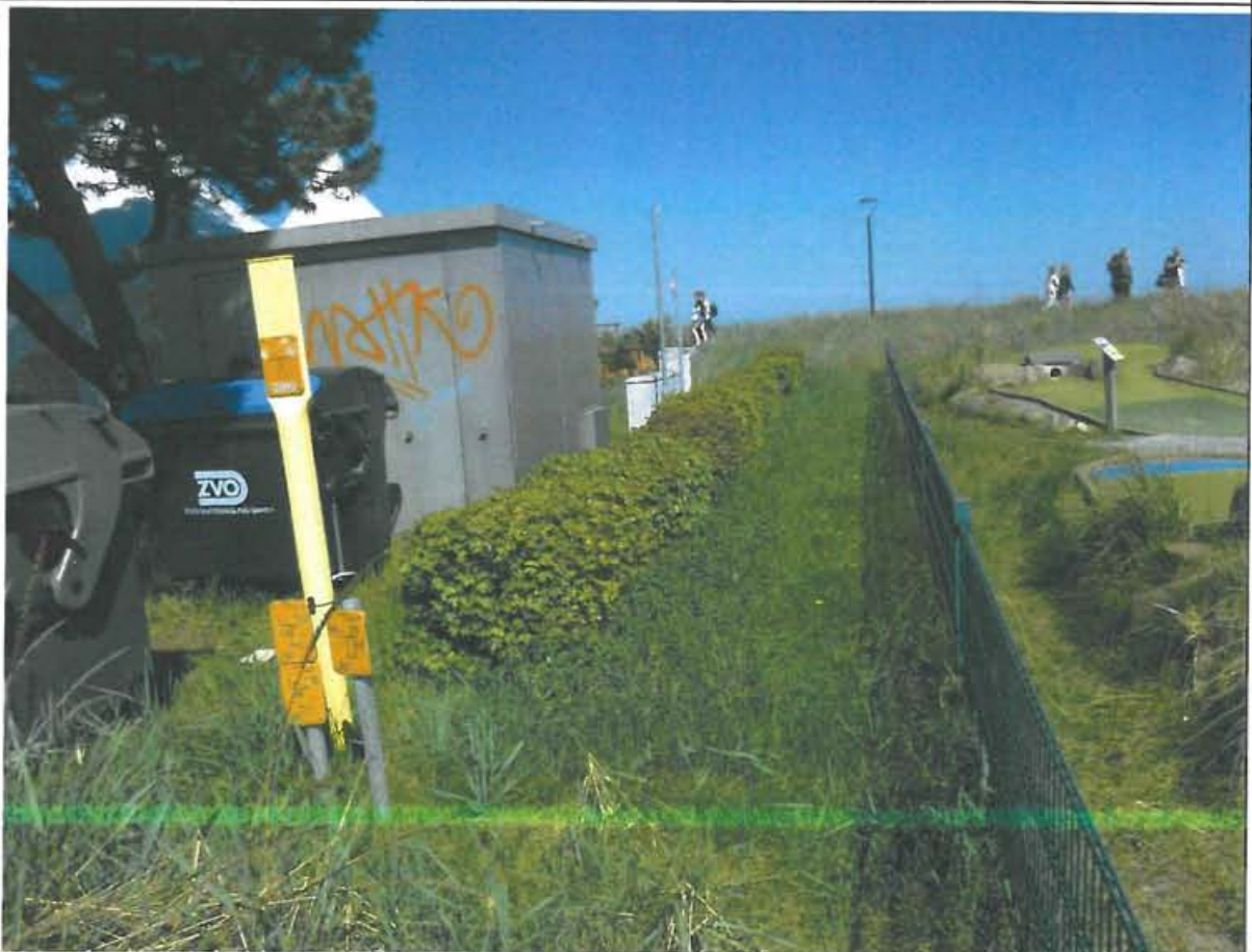
Abbildung 3: Feldahornhecke zwischen Minigolfplatz und Plangebiet.