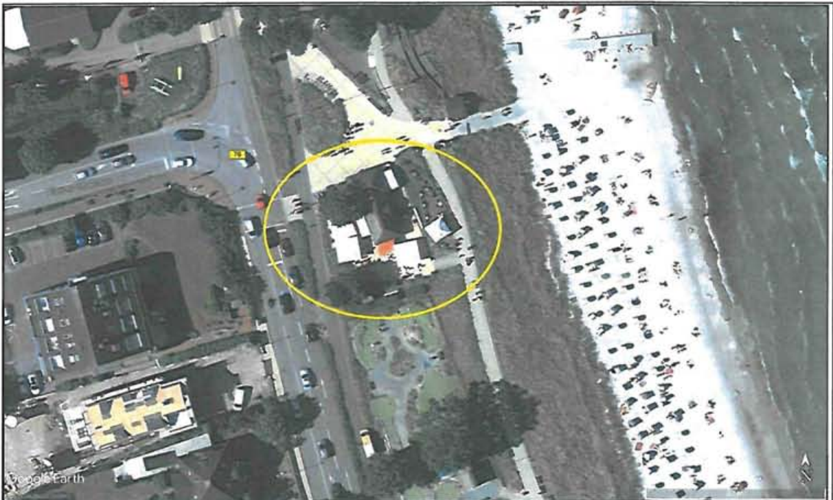
Abbildung 1: Lage des Plangebiets zwischen Strand und Strandallee