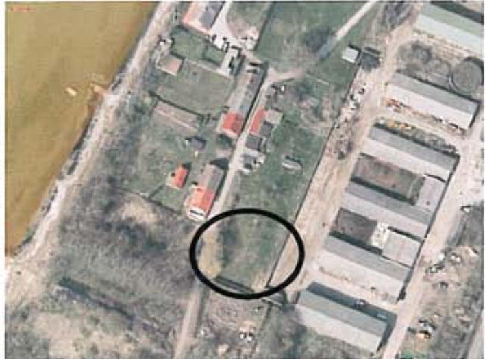
Abbildung 1: Luftbild

Gleichzeitig sollen allgemeine Angaben in der Begründung zum Immissionsschutz sowie zur Schmutzwasserentsorgung aktualisiert werden.