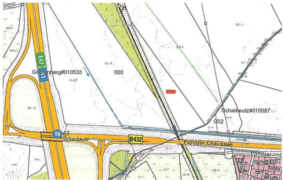
Ausgleichsfläche Gronenberg, Teilfläche des Flurstücks 214/2, Flur 0, Gemarkung Gronenberg (rot markiert)