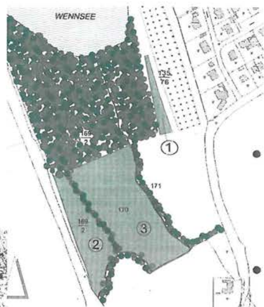
Ersatzaufforstung am Wennsee