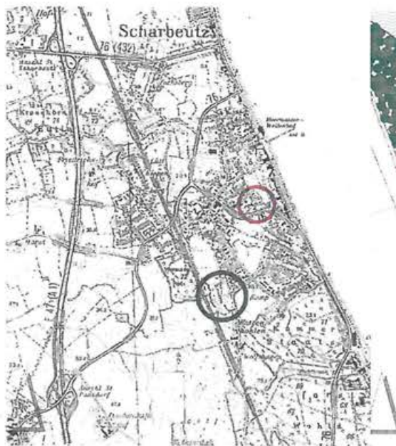
Waldumwandlung (rot) und Ersatzaufforstung (grün)