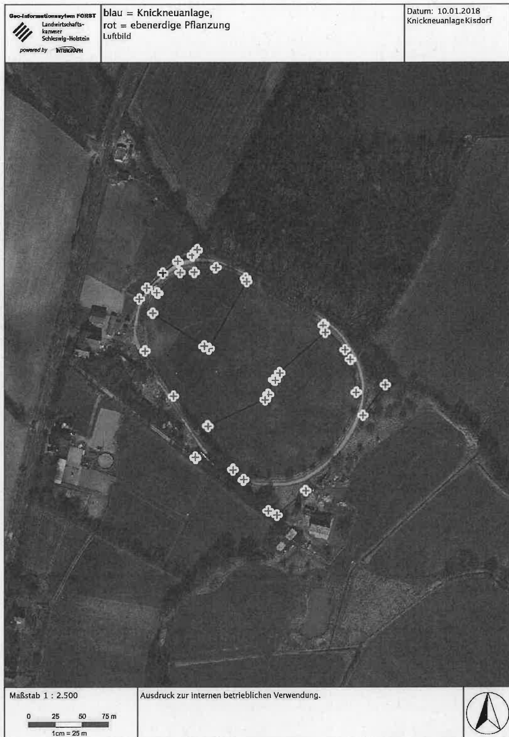
Abb. 3: Lageplan des planexternen Knickausgleichs, Luftbild M. 1:2.500 im Original