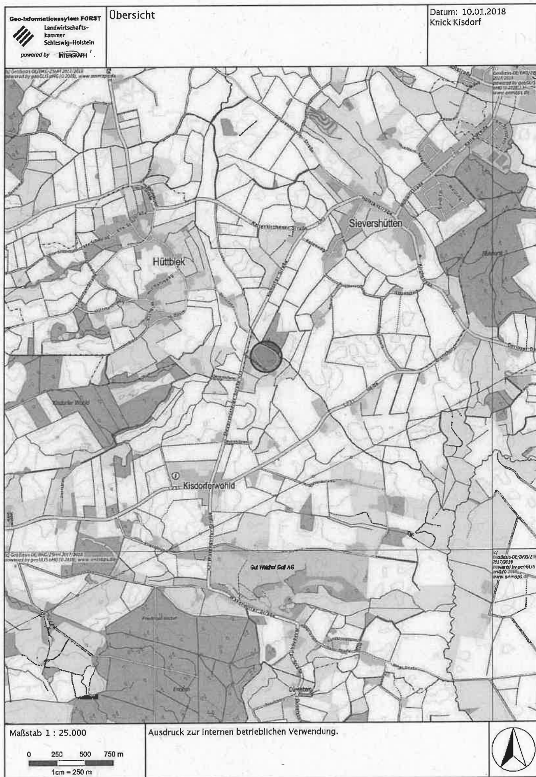
Abb. 2: Übersichtslageplan des planexternen Knickausgleichs, M. 1:25.000 im Original