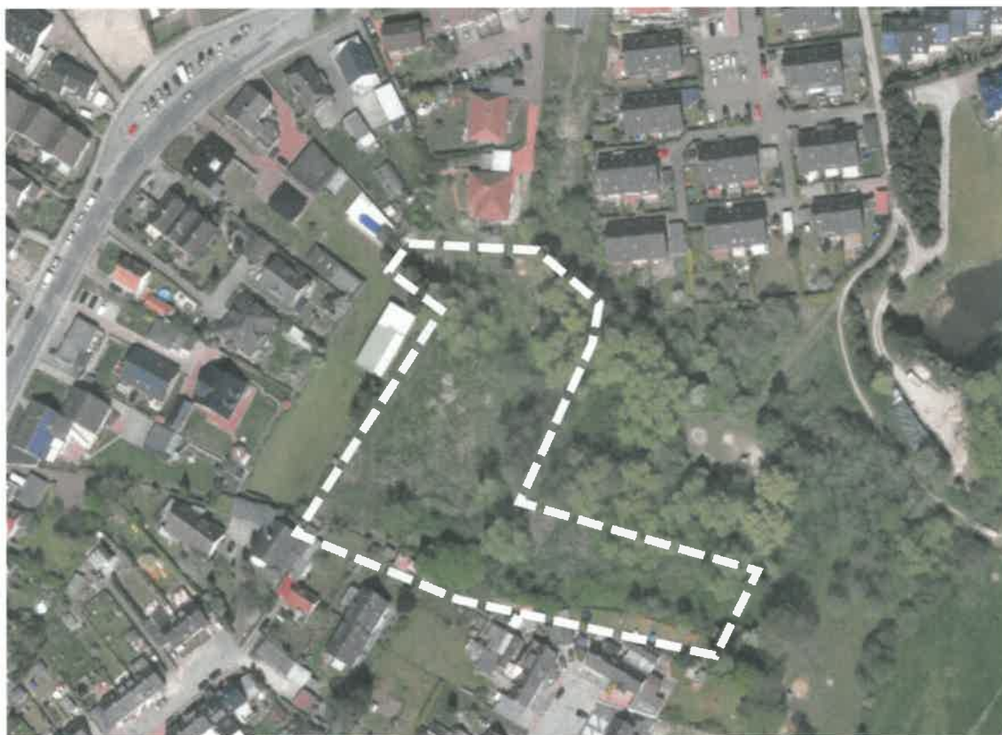
Abb.: DA Nord

Das Plangebiet, das zentral in der Ortslage Sereetz zwischen Sielbek und Dorfstraße liegt, umfasst die Flurstücke 514/45 und 514/46 der Flur 0, Gemarkung Sereetz. Das Grundstück präsentiert sich als Extensivgrünland; tlw. mit Bäumen überstellt. Nördlich, westlich und südlich angrenzend befinden sich die bebaute Ortslage Sereetz und östlich landwirtschaftlich genutzte Flächen.