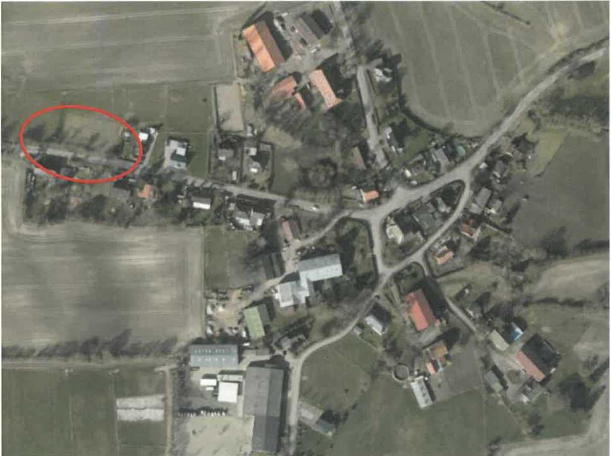
Ausschnitt Luftbild mit Ergänzungsbereich

Die Ortschaft Havekost liegt östlich von Ahrensböök und wird von der Kreisstraße 62 erschlossen. Sie hat rund 110 Einwohner.