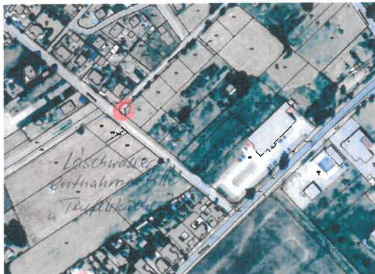
Abb. 3: Standort der Löschwasserentnahmestelle

Eine weitere Entnahmestelle befindet sich am Amtsweg im Bereich der Einmündung zum Gewerbegebiet „Das Neue Land“.