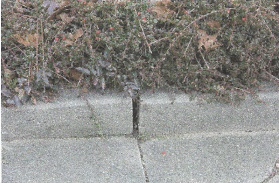
hochgedrückte Tiefborde der Randeinfassung