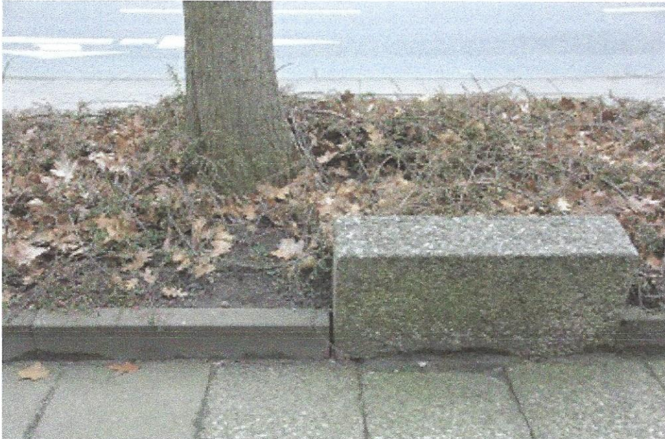
hochgedrückte Randeinfassung der Baumscheibe sowie Plattenbelag