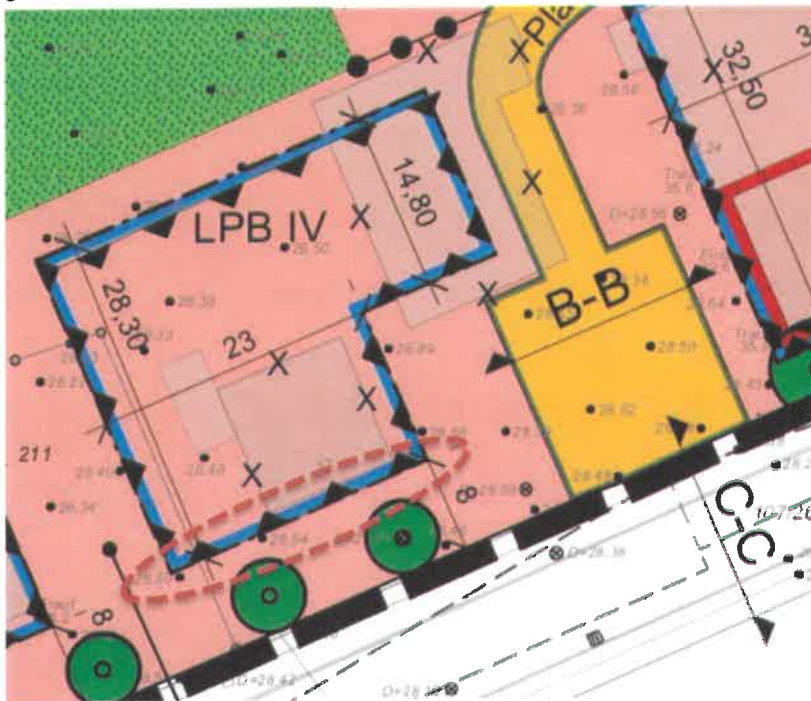
Abbildung 1: Ausschnitt aus der Planzeichnung der 5. Änderung – rot umrandet die Baugrenze, die durch die veränderte Festsetzung ausnahmsweise für Wintergärten und gastronomische Nutzungen überschritten werden darf.

Folgende Abbildung als Ausschnitt der Planzeichnung der 5. Änderung zeigt die Baugrenze, für die die Überschreitung gilt.