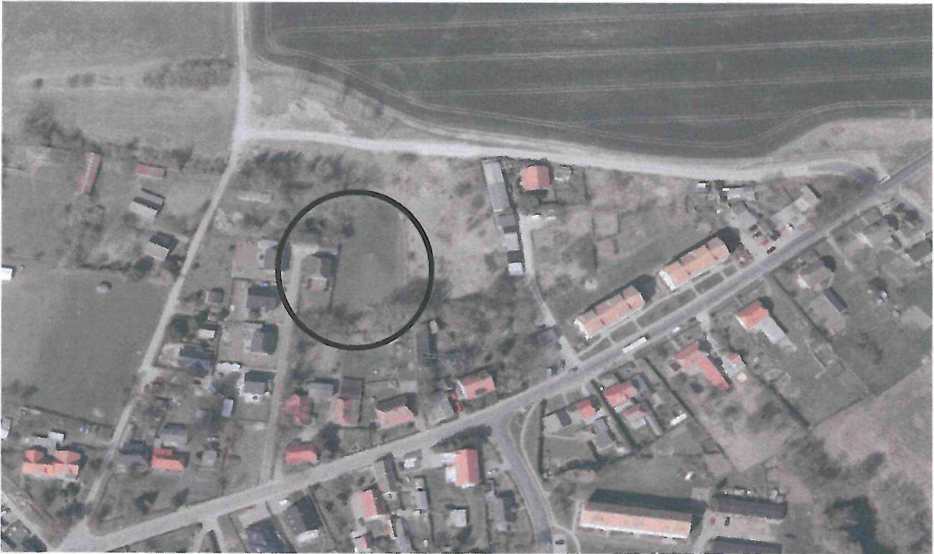
Abbildung 2: Luftbild ( www.umweltkarten.mv-regierung.de )

Westlich und südlich grenzen Siedlungsflächen an. Östlich liegt ein verwilderter Obstgarten (als Bestandteil einer alten Hofstelle). Nördlich schließt eine Gehölzgruppe (als Randeingrünung) sowie ein befestigter landwirtschaftlicher Weg (Betonspurbahn) an, der die Ortslage von den angrenzenden Ackerflächen abgrenzt.