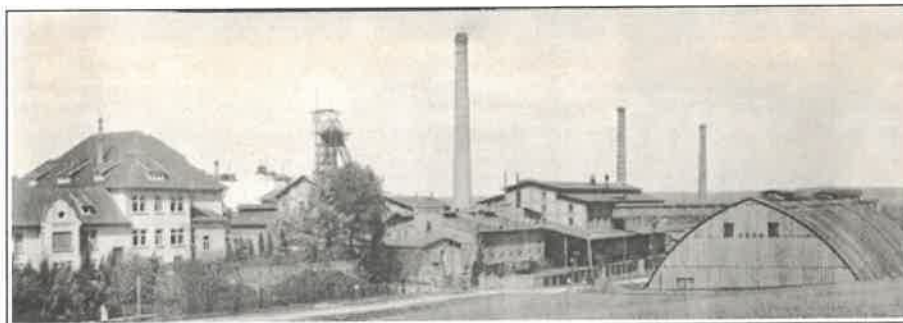
Foto des Geländes aus dem Jahr 1910

Bereits wenig später begann eine zunehmende Verlagerung der Abbautätigkeit in Richtung Morsleben, dessen Schacht im Jahr 1912 fertiggestellt wurde. Die Kali und Steinsalze wurden weiterhin in der Fabrik in Beendorf aufbereitet. Nach zwischenzeitlichen Produktionsunterbrechungen und teilweiser Nutzung des Schachtes zur Waffenproduktion im zweiten Weltkrieg und zur Hühnerhaltung nach 1945 wurde im Jahre 1969 die Salzgewinnung eingestellt und die Kali- und