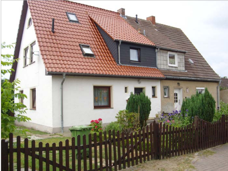
Die eingeschossigen Doppelwohnhäuser Am Torbogen besitzen ein Spitzdach und eine Schleppegaube.