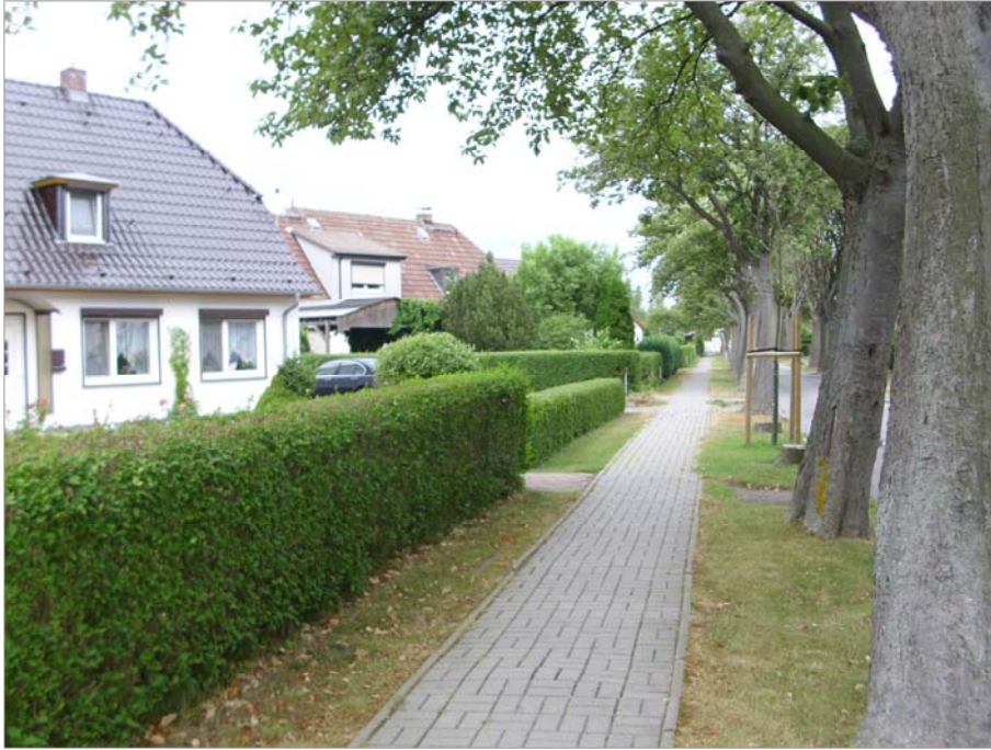
Die Vorgärten der Doppelwohnhäuser sind überwiegend mit Hecken eingefasst.