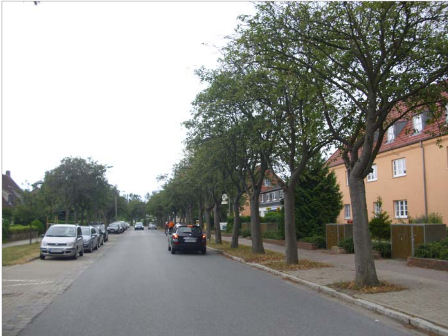
Karl-Liebknecht-Straße Blickrichtung Bug Auf der rechten Seite befinden sich zweigeschossige und eingeschossige Riegelbauten mit Dachausbau und auf der linken Seite stehen eingeschossige Doppelwohnhäuser mit Dachausbau. Die Straße wird von einer Allee aus mittelkronigen Bäumen gesäumt.