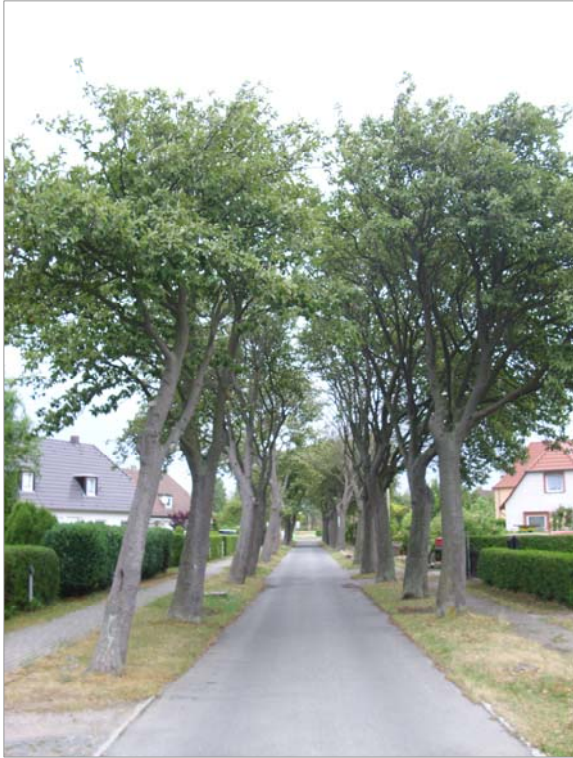
Ringstraße Für Dranske charakteristische Alleen aus mittelkronigen Laubböhlern