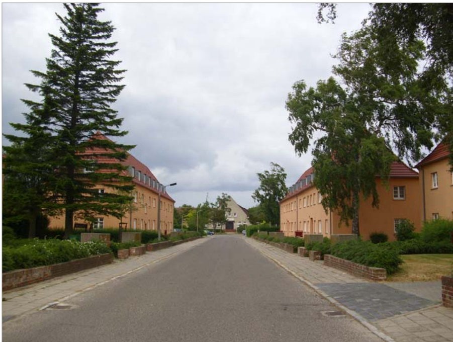
Schulstraße mit Blick zur Neuen Schule 2010 Beidseitig stehen zweigeschossige Riegelbauten mit Dachausbau und Vorgartenbereichen mit Mauereinfriedung.