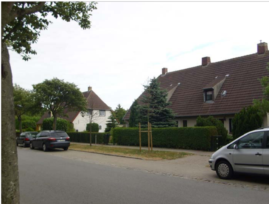
In der Karl-Liebknecht-Straße befinden sich eingeschossige Doppelwohnhäuser mit Krüppelwalmdach und Schleppegauben.