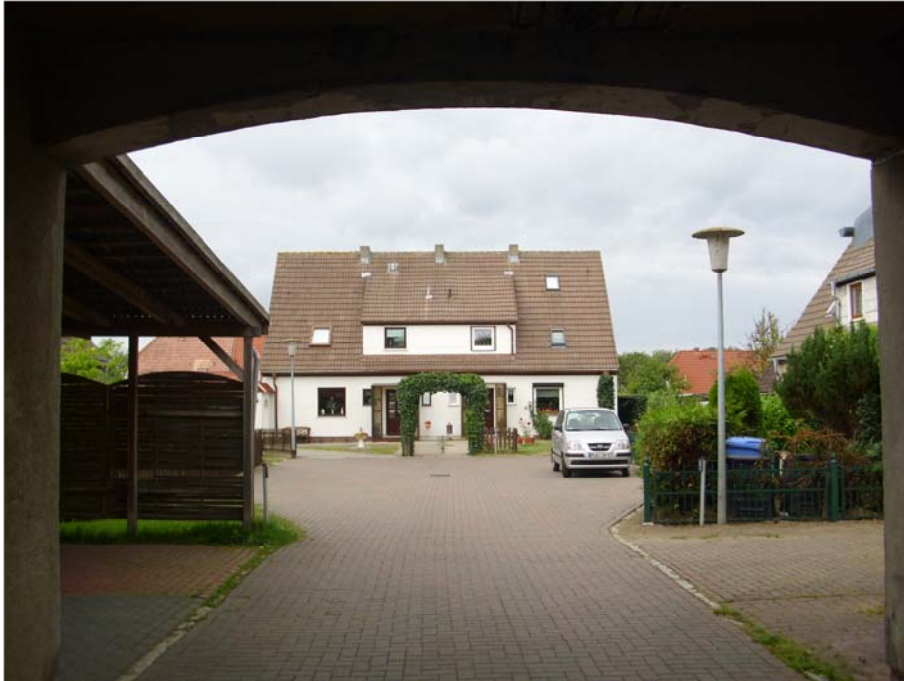
Über die Tordurchfahrt in der Karl-Liebknecht-Straße erschließt sich ein kleiner Platz, der von drei Doppelhäusern gebildet wird.