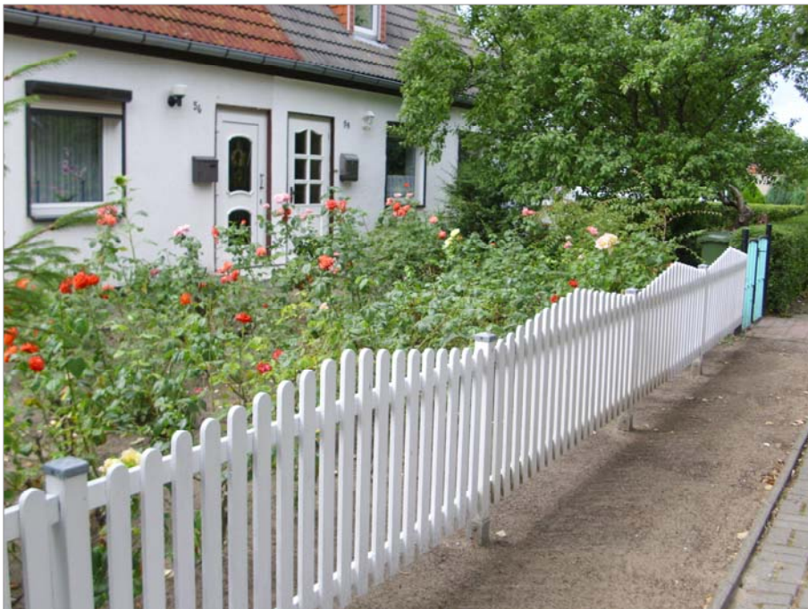
Die Vorgärten der Doppelwohnhäuser sind als Pflanzflächen zu erhalten.