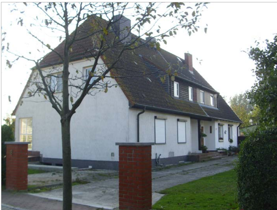
Die eingeschossigen Doppelwohnhäuser in der Wieker Straße und der Schwedenstraße haben eine Schleppegaube mit 4 Fenstern, eine zurückgesetzte Eingangstür und an der Eckfront eine verglaste Veranda (Hausnr. Wieker Straße 2, 4, Schwedenstraße 2, 4, 6, 8).