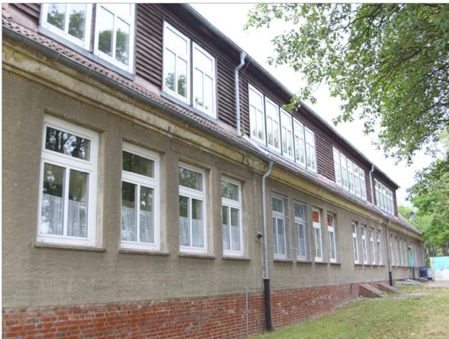
Durchgehende Schleppgauben mit horizontaler Holzverkleidung