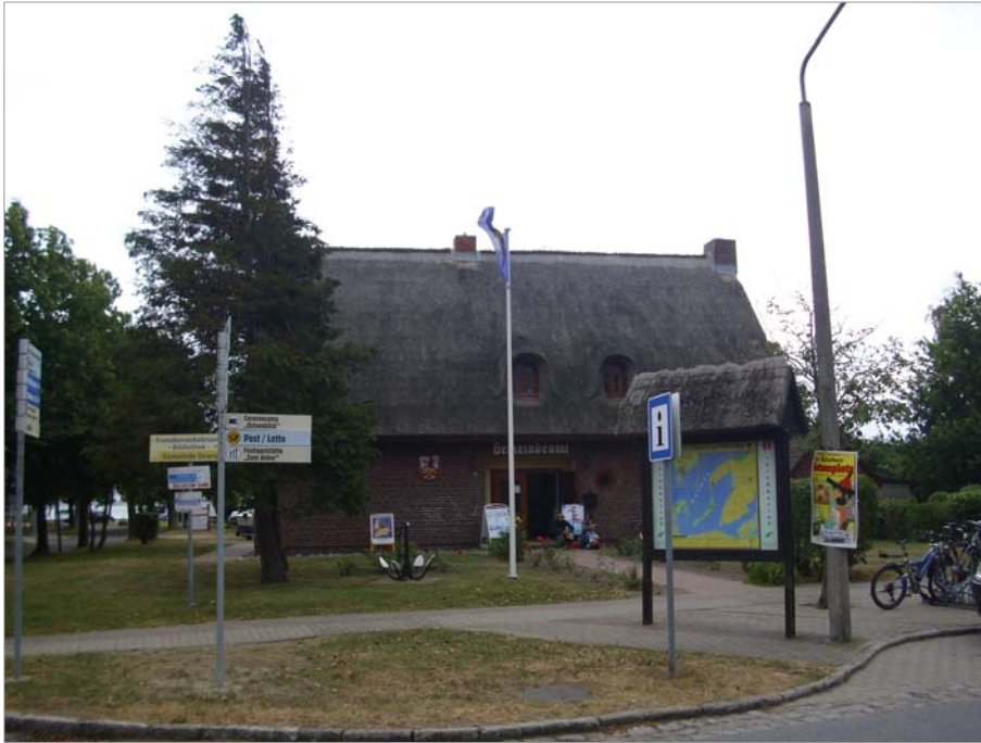
Das Haus der Gemeindeverwaltung ist backsteinsichtig, mit einem Rohrdach und stehenden Gauben mit rundem Dachabschluss erbaut worden.