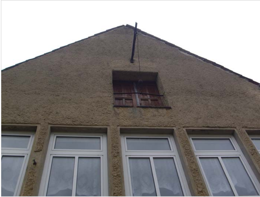
An der Giebelseite der Neuen Schule ist ein Flaschenzug zum Heben von Lasten auf den Dachboden angebracht.