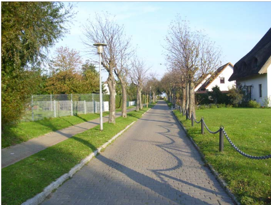
Am Ufer Blickrichtung Wieker Bodden Allee aus mittelkronigen Bäumen