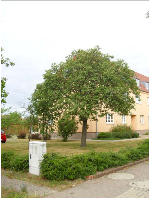
Ecke westliche Ringstraße zur Karl- Liebknecht-Straße Erhaltenswerte Solitäre der Schwedischen Mehlbeere ( Sorbus intermedia )