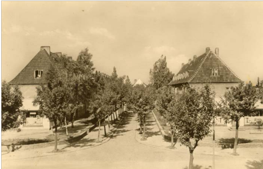
Schulstraße mit Blick zur Neuen Schule um 1950 Beidseitig stehen zweigeschossige Riegelbauten mit Dachausbau und Vorgartenbereichen mit Mauereinfassung.