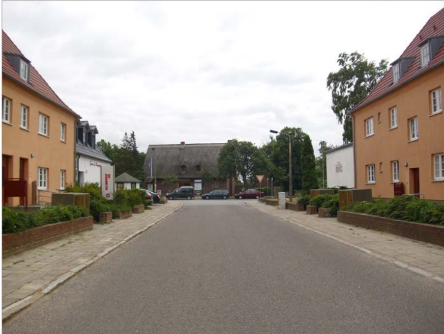
Schulstraße mit Blick zur Gemeindeverwaltung Beidseitig stehen zweigeschossige Riegelbauten mit Dachausbau und Vorgartenbereichen mit Mauereinfriedung.