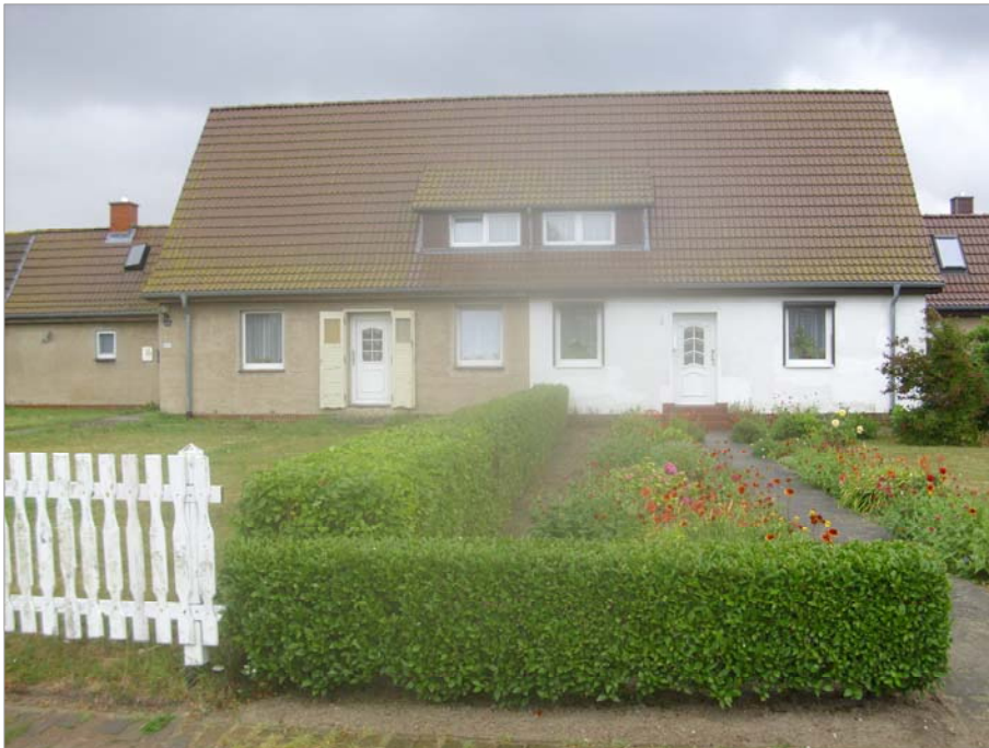
Linke Doppelhaushälfte mit extra zu schließenden Türläden.