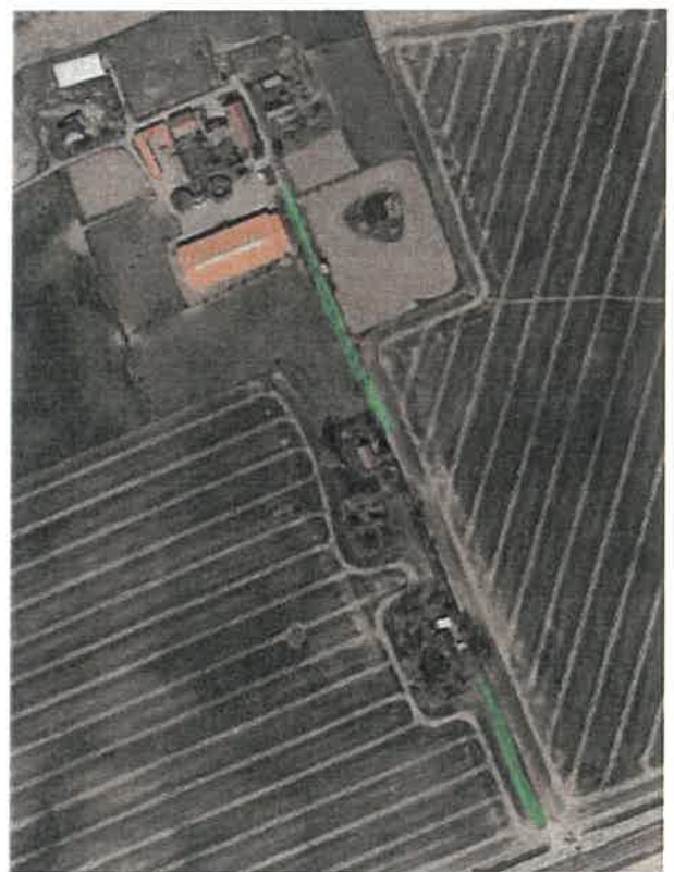
Abbildung 4: Luftbild mit Darstellung der Biotope, o.M.