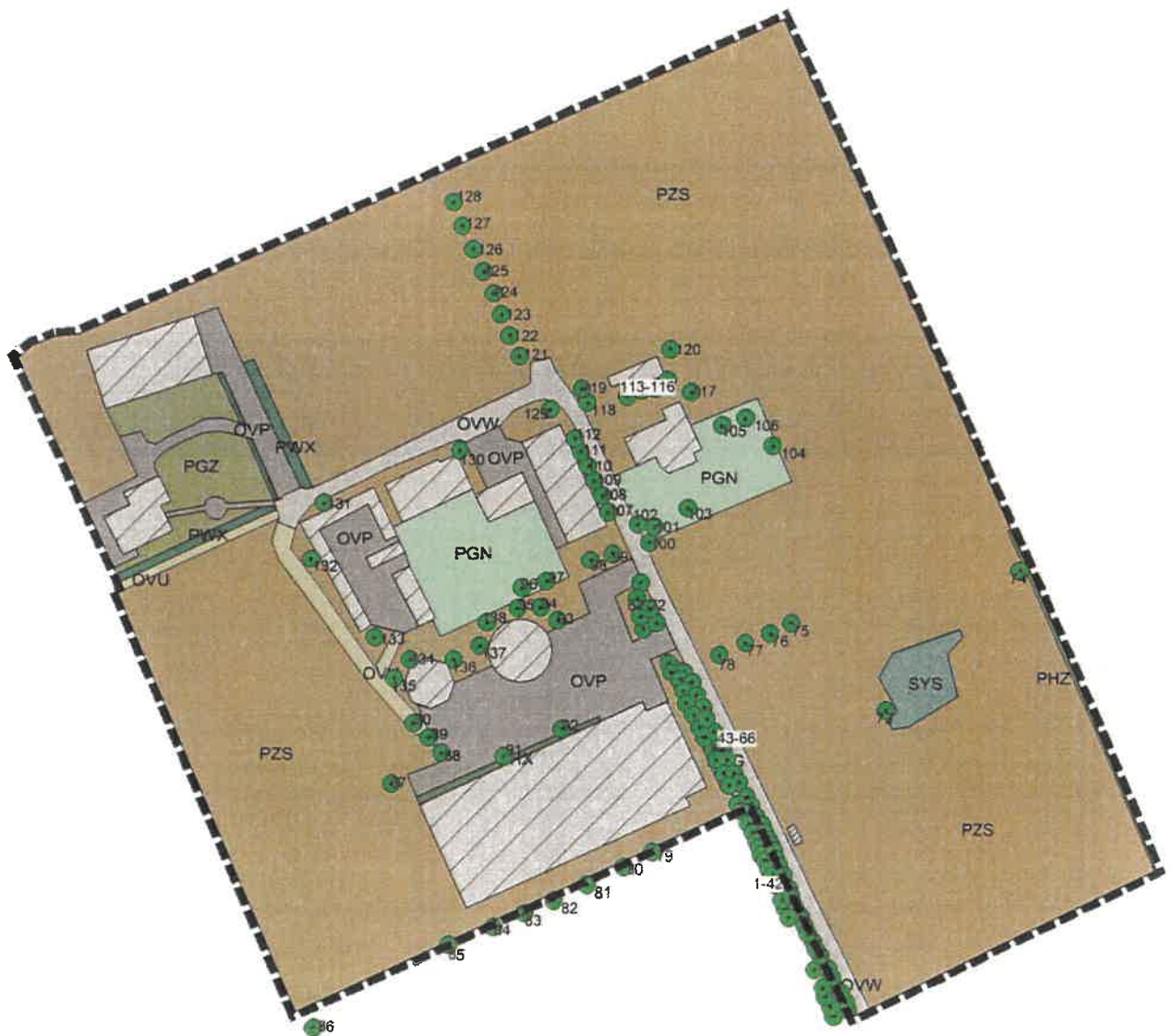
Abbildung 6 Baumkartierung

* Stammumfang aufgrund schlechter Zugänglichkeit nur geschätzt