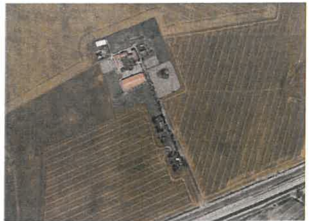
Abbildung :3 EU-Vogelschutzgebiet DE 1542-401, o.M.

Im Plangebiet ein Bodendenkmal bekannt. Das Bodendenkmal liegt randlich im Bereich der Grünfläche (Turnierplatz / Koppel). Bauliche Maßnahmen sind hier nicht geplant.