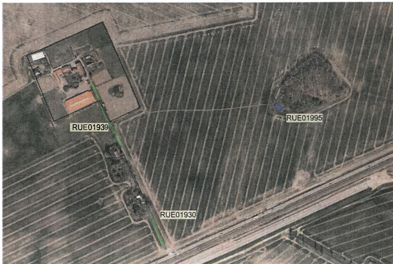
Abbildung 7 Verzeichnis gem. §20 NatSchAG M-V geschützter Biotope

Pflanzen / Bewertung: Die vorgefundenen Biototypen des Plangebietes weisen allgemeine Sied-