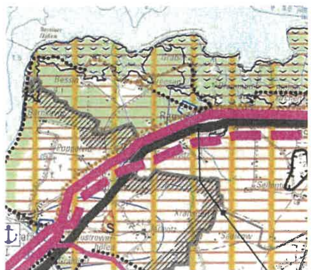
Abbildung 1: RREP VP, o.M.

In den Tourismusschwerpunkträumen stehen die Verbesserung der Qualität und der Struktur des touristischen Angebotes sowie Maßnahmen der Saisonverlängerung im Vordergrund. Grundsätzlich soll der Tourismus nach 3.1.3 (5) als bedeutender Wirtschaftsbereich in der Region Vorpommern stabilisiert und nachhaltig entwickelt werden. Dazu sind vielfältige, ausgewogene und sich ergänzende Angebote zu schaffen. Stärker als bisher sind