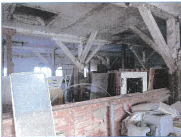
Abb. 5 Mit Kot von Rauchschwalben befleckte Gegenstände im ehem. Stallgebäude.

Zudem wurden der Rotschwanz und die Bachstelze beobachtet, die ihre Nistplätze jedoch nicht am betreffenden Gebäude haben, sondern regelmäßig andere Gebäude angefliegen haben.