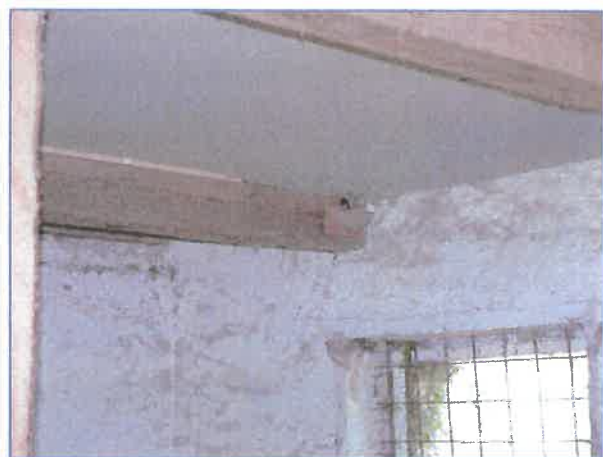
Abb. 10 Beispiel für die 10 Ersatznistplätze für Rauchschnalben im bestehenden Pferdestall, welche bereits im Mai 2019 teilweise genutzt wurden.

Bei der Begehung zur Potentialabschätzung in 2020 wurden keine Höhlungen in Gehölzen gefunden, so dass hier Höhlenbrüter ausgeschlossen werden können. Die Vegetationsstrukturen in der Ortslage lassen ein typisches Artenspektrum ländlicher Ortschaften erwarten. Während der Begehung konnten folgende Arten durch Sichtbeobachtung oder Verhören in der Ortslage festgestellt werden: