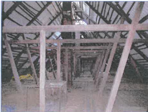
Abb. 7 Dachboden des ehem. Stallgebäudes.