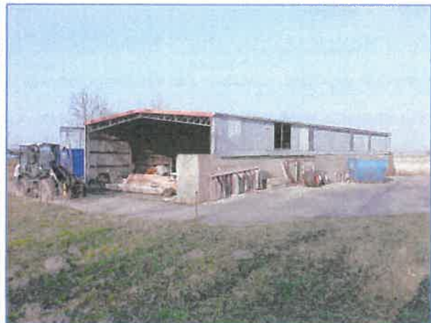
Abb. 8 Wellblechhalle, die abgebaut und dann an anderer Stelle neu errichtet werden sollte.