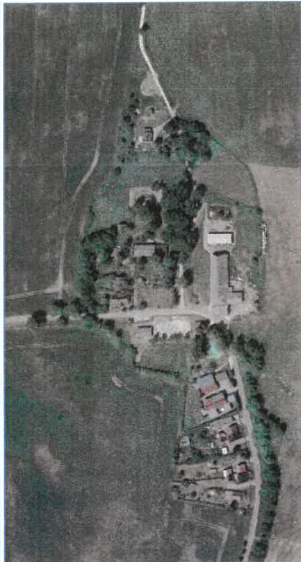
Abb. 3 Luftbild Grabitz, Gemeinde Rambin