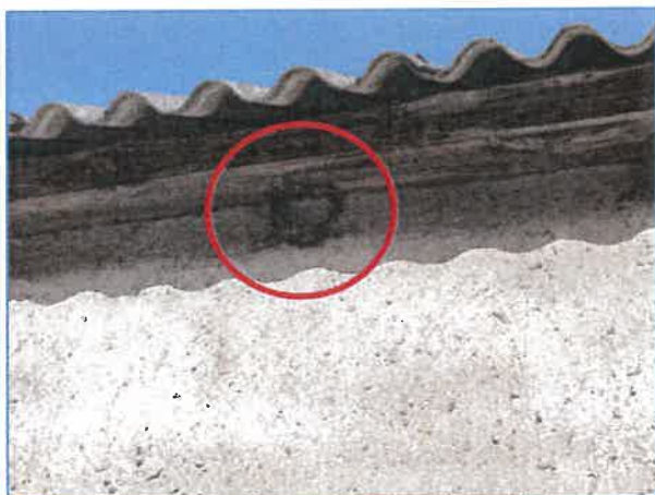
Abb. 6 Altes Mehlschwalbennest.