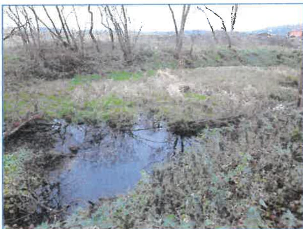
Abb. 4 Teich am Rand des Plangebietes (Dezember 2020).

Ein weiteres Kleingewässer (temporär wasserführend, starke Verlandung - Flutrasen) liegt außerhalb am Rand des Plangebietes. Hier konnten auf Grund von Wassermangel im Frühjahr keine Amphibien festgestellt werden.