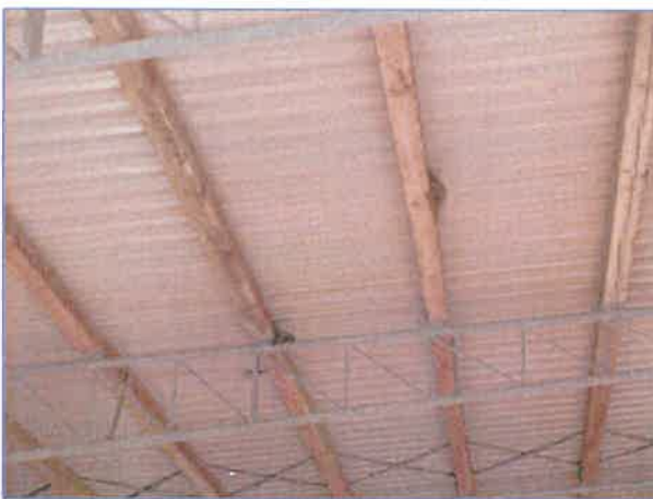
Abb. 9 Rauchschnalbenester unter dem Dach der Wellblechhalle.