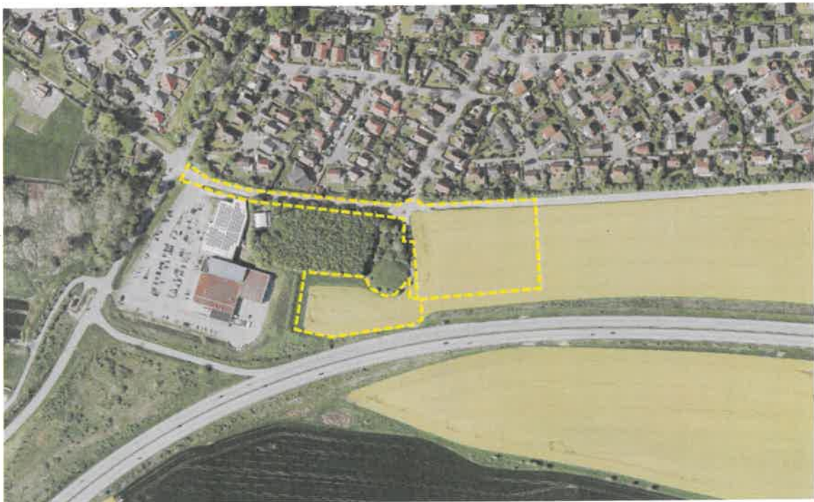
Abb.: Digitaler Atlas Nord mit Geltungsbereich 48.FNPÄ

Die städtische Fläche am Höhenweg schließt südlich an die bebaute Ortslage Heiligenhafens an. Das Areal grenzt im Süden an die Bundesautobahntrasse der A1, im Norden grenzt es an die Bebauung des Höhenweges. Zudem umfasst es den Höhenweg selbst bis an den Kreuzungsbereich Bergstraße. Südöstlich der Autobahntrasse befindet sich eine ältere Windkraftanlage als Einzelanlage. Das Plangebiet ist derzeit nur über einen Schotterweg erschlossen, dennoch ist eine Zufahrt über die Straße Rauher Berg, Höhenweg und Neuratjensdorfer Weg möglich. Der Schotterweg führt zudem an einem archäologischen Denkmal, dem Grabhügel „Rauher Berg“ vorbei und endet vor einem Wasserspeicher des ZVO.