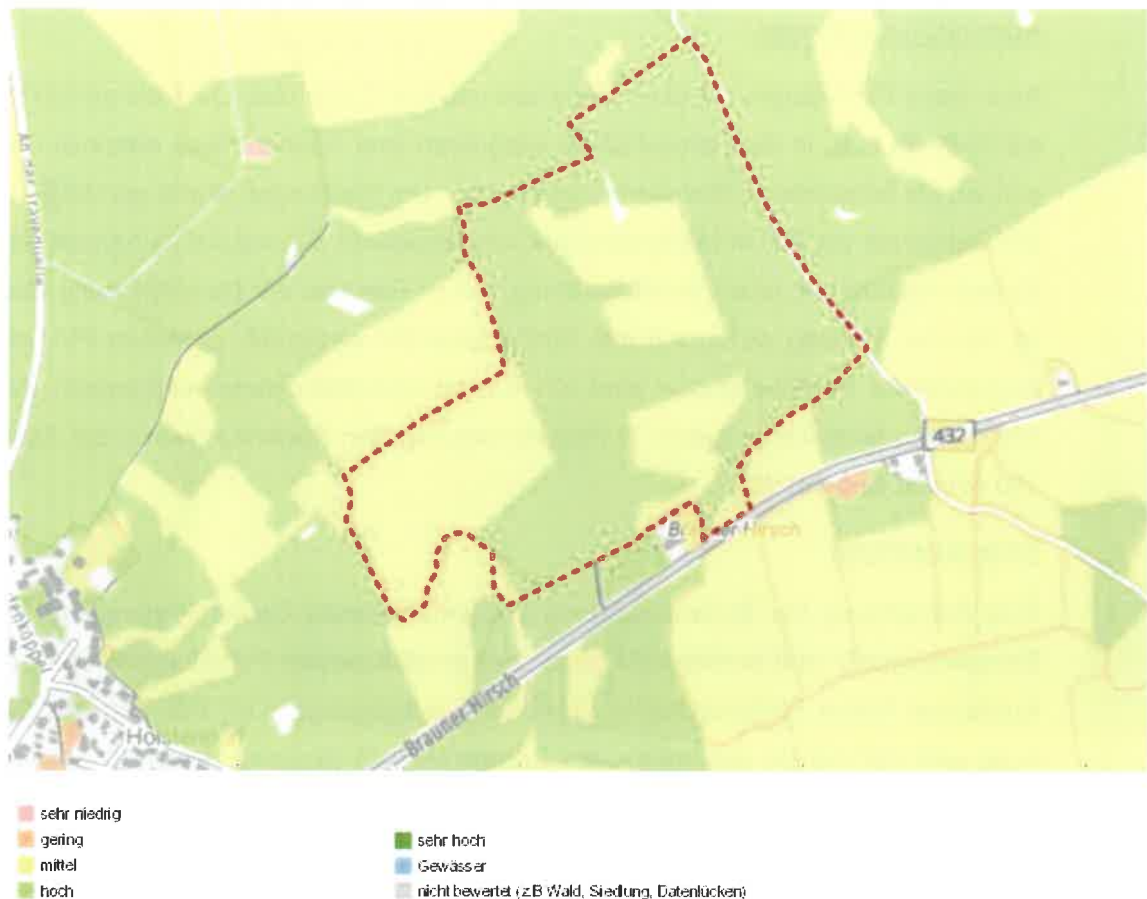
Abb.: Plangebiet - natürliche Ertragsfähigkeit regional bewertet

Unter genauer Betrachtung in einem detaillierteren Maßstab lässt sich erkennen, dass das Plangebiet teilweise mit einer Ertragsfähigkeit „mittel“ und teilweise mit einer Ertragsfähigkeit „hoch“ bewertet wurde.