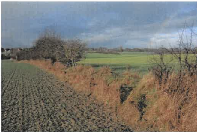
Foto: lückiger Knickabschnitt an der Westgrenze des Plangebietes, Blickrichtung West

Nach Norden, Westen und Süden ist das Plangebiet von Knicks (HWy§) und Feldhecken (HF§) eingefasst. Da die Knickwälle streckenweise stark verkümmert oder nicht vorhanden sind, sind die Übergänge hier fließend. Die Knicks und Feldhecken im Norden, Nordwesten und Süden weisen überwiegend einen mäßigen Erhaltungszustand auf. Sie sind mit Überhältern aus Stieleichen ( Quercus robur ) bestanden und weisen einen einreihigen, streckenweise lückigen Bewuchs aus Weißdorn ( Crataegus monogyna ), Schlehe ( Prunus spinosa ), Haselnuss ( Corylus avellana ), Zitterpappel ( Populus tremula ), Holunder ( Sambucus nigra ) und Feldahorn ( Acer campestre ) in der Strauchschicht auf.