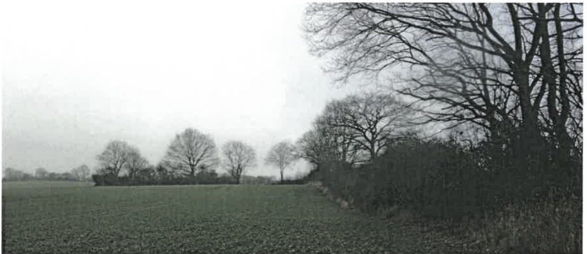
Foto: Knick und Feldhecken an der Nordgrenze