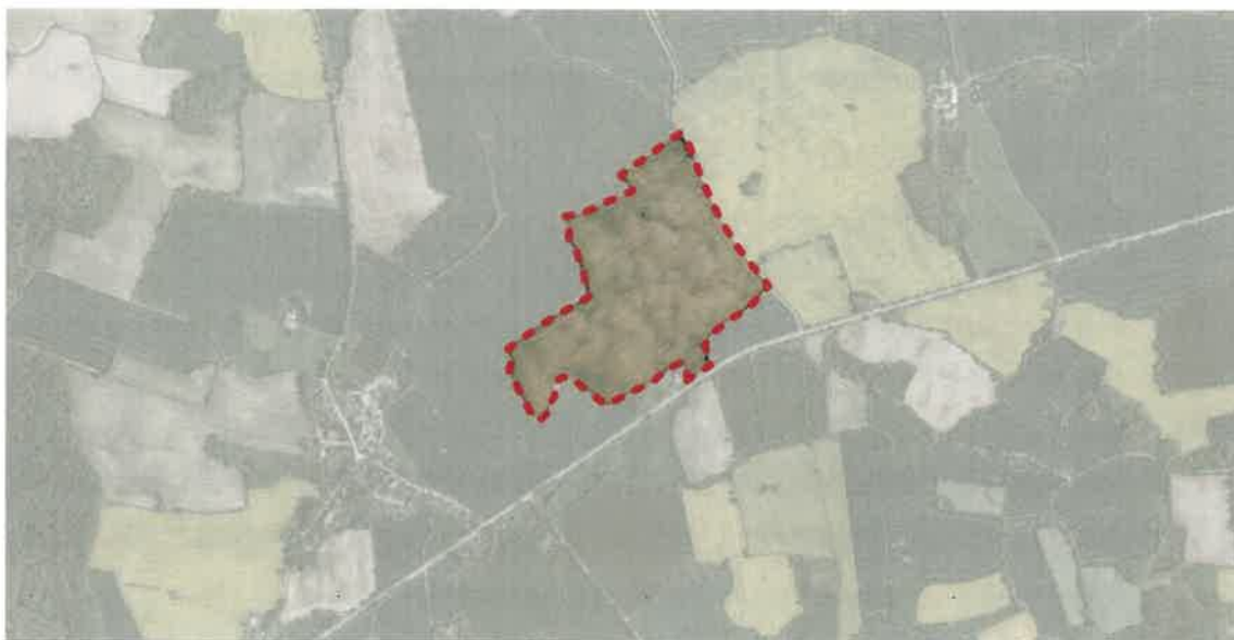
Abb.: Luftbild mit Geltungsbereich, Digitaler Atlas Nord

Das Plangebiet liegt östlich vom Ortsteil Ahrensböök, angrenzend an eine gewerbliche Fläche. Bei dem Plangebiet handelt es sich um Ackerschläge, die teilweise durch Knickstrukturen zониert sind. Nördlich des Geltungsbereichs befindet sich eine Waldfläche.