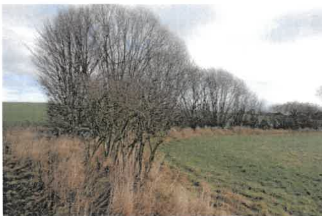
Foto: Feldhecke aus Weiden im Südwesten

Die nach Norden und Süden an den Redder angrenzenden linearen Gehölzstrukturen sind streckenweise aus nur wenigen Arten Zitterpappel oder Weiden aufgebaut.