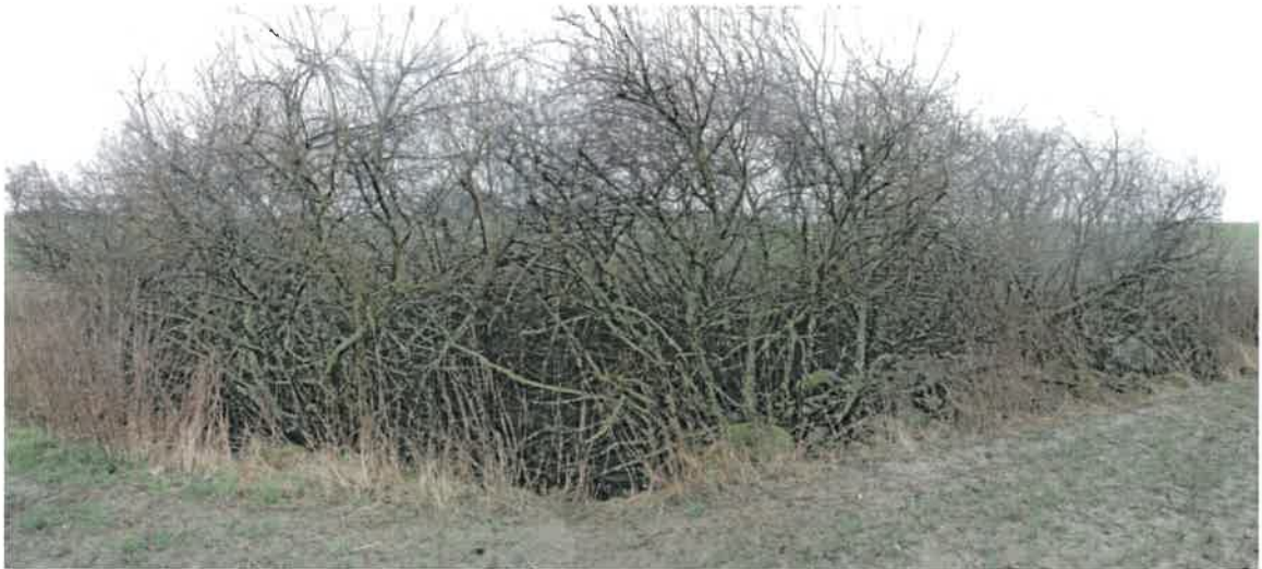
Foto: Weidengebüsch auf Vorhabenfläche

Innerhalb der Vorhabenfläche befindet sich im nördlichen Teilbereich eine ca. 190 m 2 große, trockene Senke, die flächig mit Weiden ( Salix i.S.) bewachsen und als Weidengebüsch außerhalb von Gewässern (HBw) anzusprechen ist.