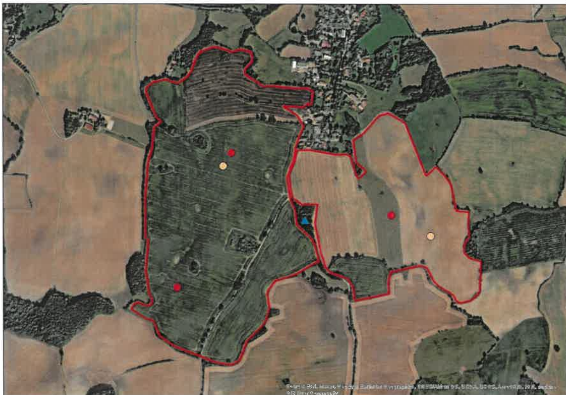
Abbildung 4: Lage der Reviere besonders planungsrelevanter Arten. (roter Punkt: Feldlerche; hellbrauner Punkt: Wachtel; blaues Dreieck: Neuntöter).

Die Lage der Revier der anspruchsvolleren und zum Teil gefährdeten Arten Feldlerche, Wachtel und Neuntöter ist in der folgenden Abbildung 4 dargestellt.