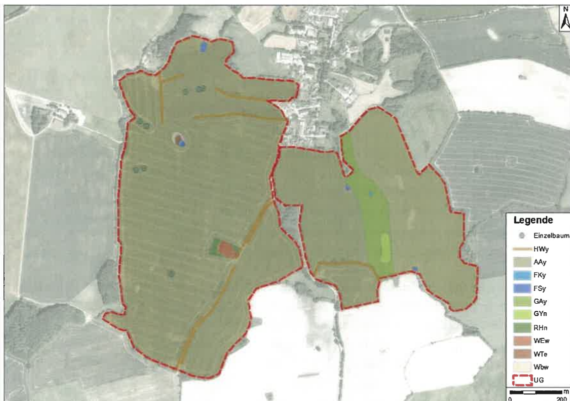
Abbildung 3: Biotoptypenausstattung des Plangebietes.

Knickbestände sind gemäß § 21 LNatSchG SH gesetzlich geschützt.