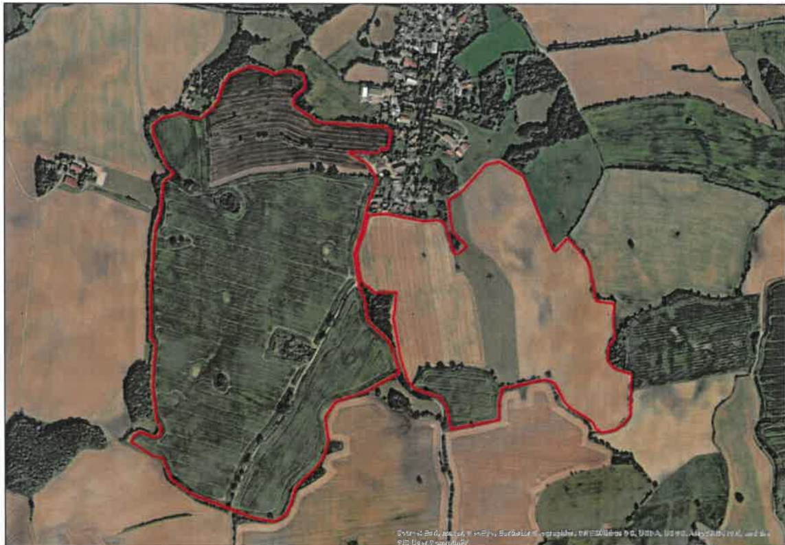
Abbildung 1: Lage und Abgrenzung des Plangebietes in der Gemeinde Ahrensböck.

In der Gemeinde Ahrensböck, Ortsteil Schwochel, ist im Bereich von Acker- und Grünlandflächen südlich und südwestlich der Ortschaft die Errichtung einer Photovoltaik-Freiflächenanlage (PV-Anlage) geplant. Das Plangebiet umfasst eine Größe von etwa 100 ha (vgl. Abbildung 1).