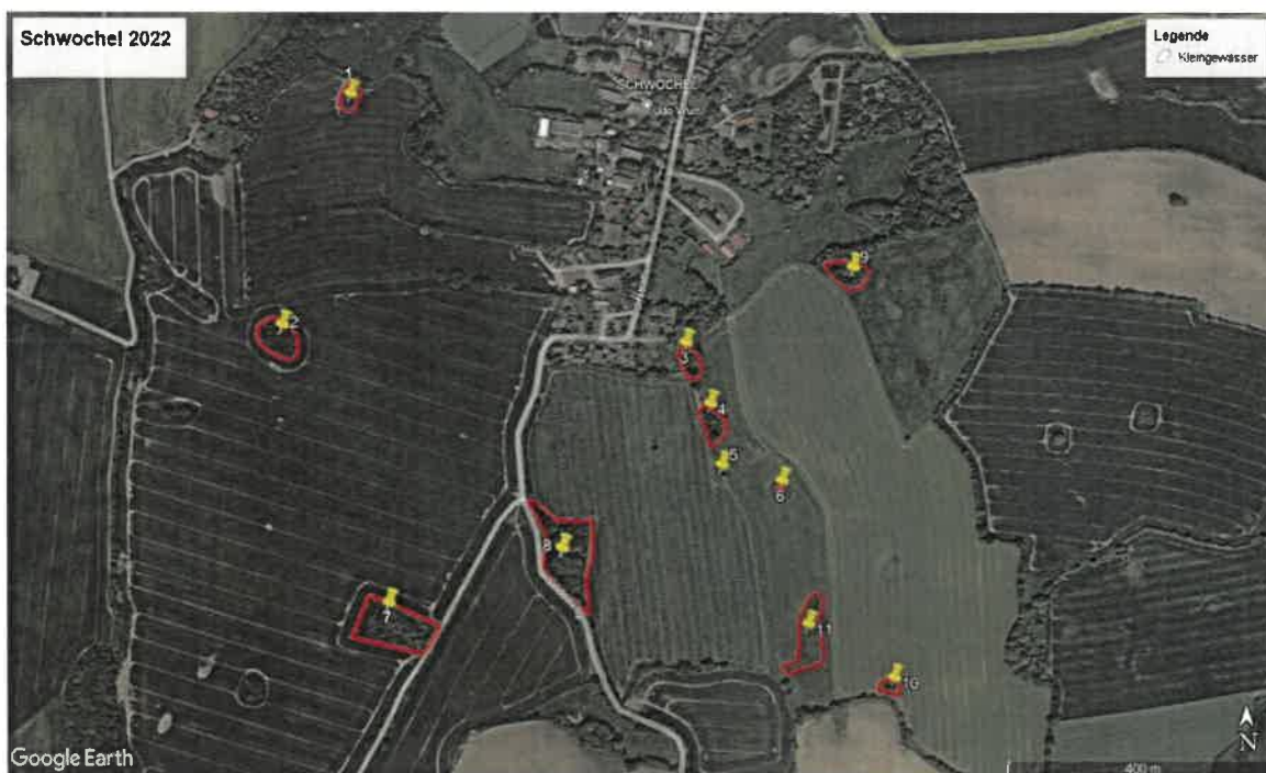
Abbildung 2: Im Rahmen der Amphibienkartierung untersuchte geeignete Lebensraumstrukturen.