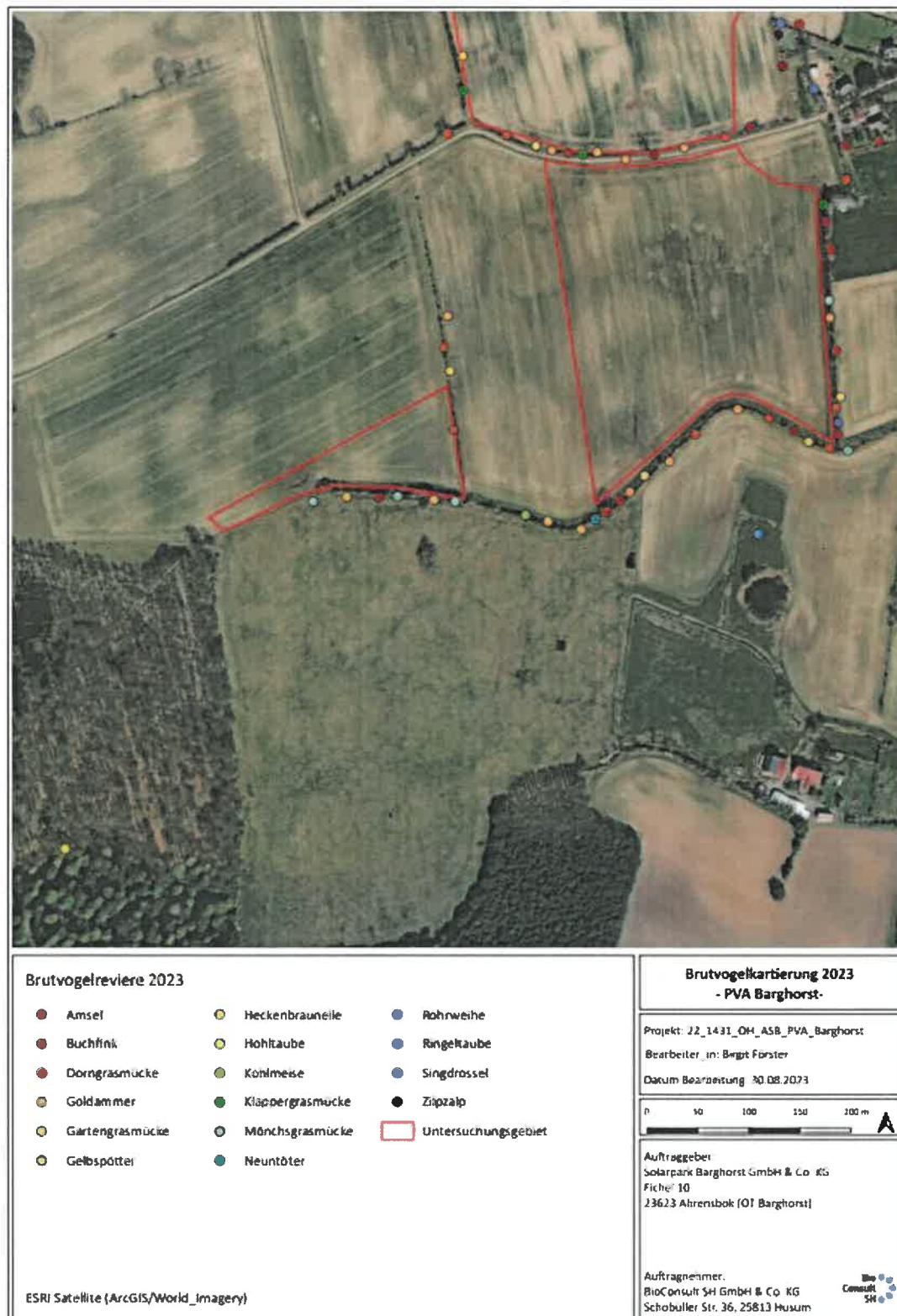
Abb. 7.1 Übersicht über die Brutvogelreviere, die auf den beiden südlichen Teilflächen (3 und 4) der PVA Barghorst und im direkten Nahbereich im Jahr 2023 festgestellt wurden.