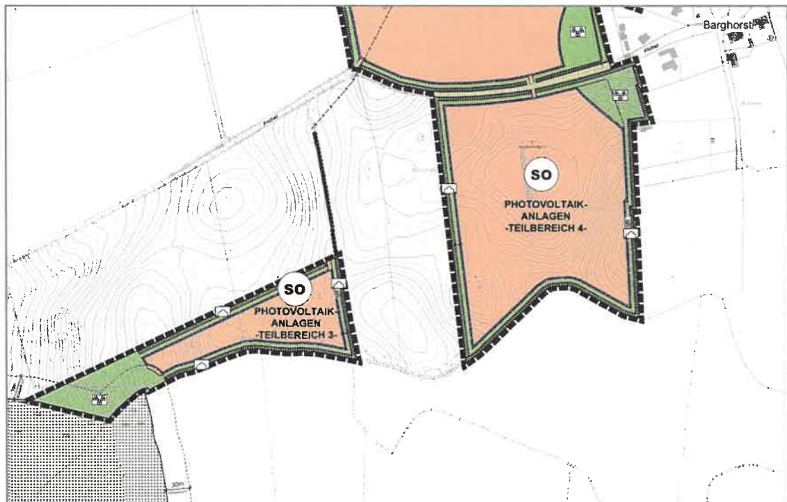
Abb. 2.5 Entwurfsplanung für die beiden südlichen Teilflächen (3 und 4) zur Errichtung von Photovoltaik- anlagen im Außenbereich der Gemeinde Ahrensböök, OT Barghorst (Bebauungsplan Nr. 80 der Gemeinde Ahrensböök, Vorentwurf, Stand: 11. Juli 2022).

Die Lage und Ausdehnung der Teilflächen 3 und 4 geplanten PV-Anlage im Außenbereich des Orts- teils Barghorst sind in Abb. 2.5 dargestellt. Die genaue Anlagenkonfiguration stand zum Zeitpunkt dieser Planungsunterlage noch nicht fest. Typ und Anzahl der Solarmodule, Hersteller sowie die Reihenabstände, Höhe und Neigungswinkel der Module, Zaunhöhe, etc. werden erst im weiteren Planungsverlauf festgelegt. Laut PVA-Erlass des Landes Schleswig-Holsteins (MILIG & MELLUND 2021) muss die Unterkante des Zaunes einen Bodenabstand von mindestens 20 cm haben.