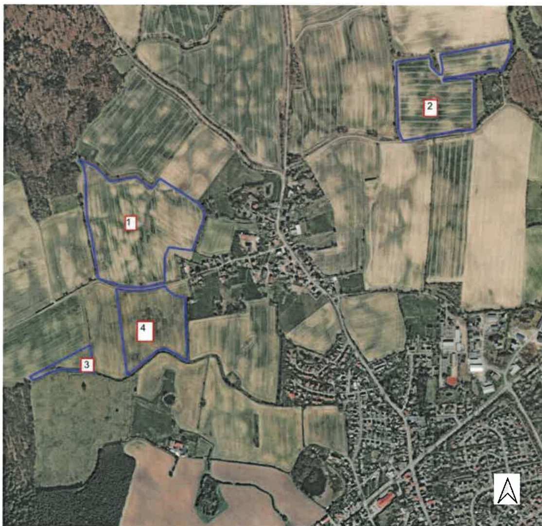
Abb. 1.1 Lage der vorgesehenen Flächen (blau markiert) zur Errichtung der PVA westlich und nordöstlich der Ortschaft Barghorst, Gemeinde Ahrensböök, Kreis Ostholstein.

Gegenstand des vorliegenden Artenschutzfachbeitrages sind die Teilflächen 3 und 4 .