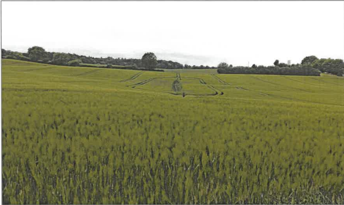
Abb. 2.2 Übersicht über die südöstliche Teilfläche (Nr. 4) der geplanten PVA Barghorst mit den nördlich angrenzenden linearen Gehölzstrukturen sowie der Senke und dem Graben in der Mitte der Fläche, Blick von Süden nach Norden (Foto: B. Förster, 30. Mai 2023).

Das Relief der Fläche 4 ist etwas hügelig (Abb. 2.2, Abb. 2.3), während die Fläche 3 überwiegend flach verläuft und in Richtung Süden leicht abfällt. Beide Flächen werden teilweise von artenreichen Knicks gesäumt. Im Bereich der Fläche 3 wird der südliche Knick von einem schmalen Graben begleitet, der jedoch zum Zeitpunkt der Begehung kein Wasser führte. Der südliche Knick sowie der Knick an der östlichen Seite der Fläche 4 zeigen auf ihrer gesamten Länge eine sehr gute Struktur, dem gegenüber ist der mittlere Knick (an der östlichen Seite der Fläche 3) weniger stark ausgeprägt (niedriger, schmaler und im nördlichen Teil lückig bewachsen).