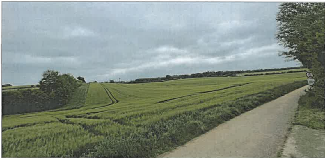
Abb. 2.3 Übersicht über das leicht hügelige Relief der Teilfläche 4 mit dem nördlich verlaufenden Wirtschaftsweg und den östlich angrenzenden Gehölzstrukturen, Blick von Nordosten nach Südwesten (Foto: B. Förster, 30. Mai 2023).