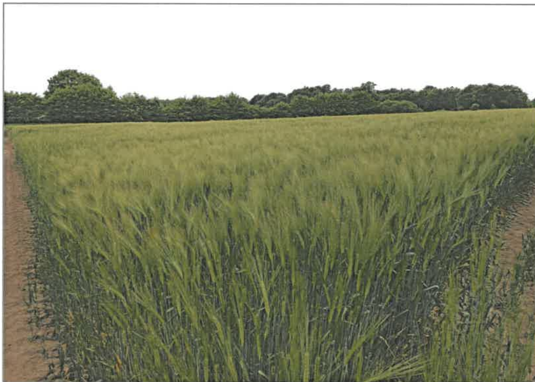
Abb. 2.1 Übersicht über die südwestliche Teilfläche (Nr. 3) der geplanten PVA Barghorst mit den südlich angrenzenden linearen Gehölzstrukturen, Blick von Nordosten nach Südwesten (Foto: B. Förster, 30. Mai 2023).

Am 30.05.2023 fand eine Begehung der Flächen sowie der angrenzenden Bereiche für die artenschutzrechtliche Potenzialabschätzung statt. Die hier zu betrachtenden Teilflächen 3 und 4 der geplanten PVA Barghorst waren im Untersuchungsjahr 2023 mit Getreide bestellt (s. Abb. 2.1 und Abb. 2.2).