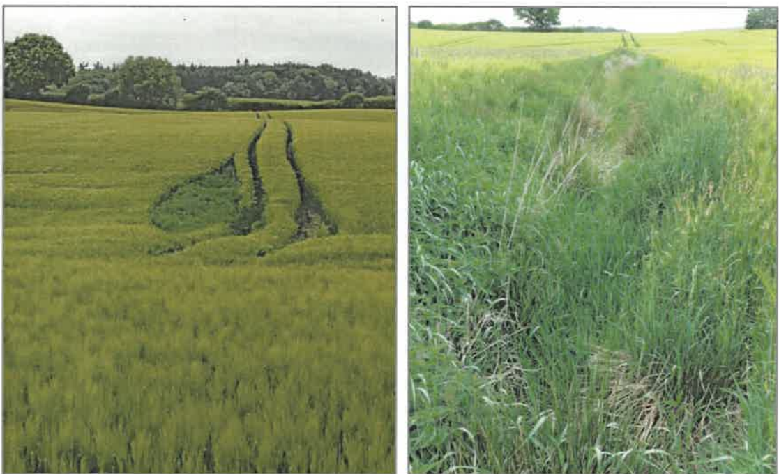
Abb. 2.4 Sowohl die Senke (links) als auch der Graben (rechts) innerhalb der Teilfläche 4 waren zum Zeitpunkt der Begehung trocken, Blick jeweils von Süden nach Norden (Foto: B. Förster, 30. Mai 2023).