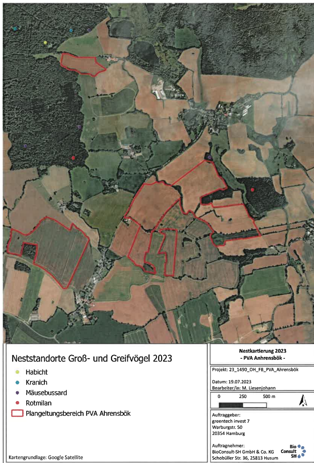
Abb. 6 Darstellung der im Jahr 2023 ermittelten Neststandorte von Groß- und Greifvögeln im Untersuchungsgebiet der geplanten PVA Ahrensböck.