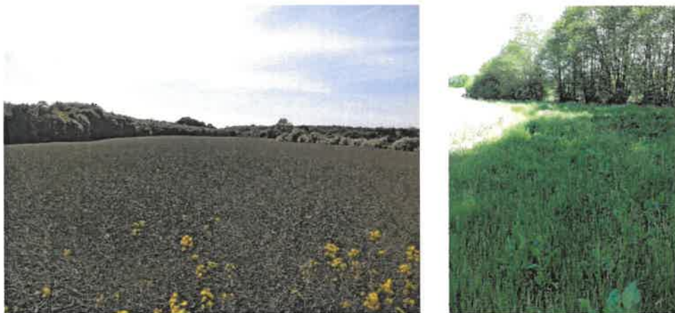
Abb. 2 Blick über die nördliche Teilfläche des Vorhabengebietes. Links: Blick von West nach Ost. Rechts: Saumbereich im Süden der Fläche und umliegende Baumreihen.

Das etwas abseits gelegene nördliche Teilgebiet wird von artenreichen Knicks umrandet und grenzt an ein reich strukturiertes Grünland sowie Waldstrukturen an (Abb. 2). Alle weiteren Teilflächen werden von Knicks und Feldhecken gesäumt; im Osten grenzt ein Autal an das Vorhabengebiet (Curauer Au). Das westliche Teilgebiet besteht aus einem großen Getreideacker mit einem kleinen Soll im Westteil (Abb. 3), südlich schließt sich eine Wildstaudenflur bzw. brachliegende Wiese entlang eines kleinen Baches an. Im Süden des östlichen Teilgebietes befindet sich eine kleine Brachfläche. Darüber hinaus erstreckt sich außerhalb des Vorhabengebietes nordöstlich entlang der Curauer Au ein extensiv genutzter Grünlandbereich. Zwischen den Teilflächen befindet sich ein Intensivgrünland.