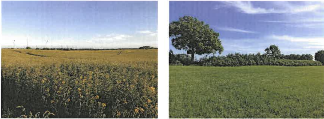
Abb. 4 Links: Übersicht über die südliche Teilfläche des Vorhabengebietes, mit Blick von Nord nach Süd. Rechts: Östliche Teilfläche mit Blick auf Knickstruktur..

Der Standort besitzt potenzielle Lebensräume für Brutvögel innerhalb des gesamten Untersuchungsgebietes. Dies betrifft insbesondere die Gilden ‚Brutvögel des Offenlandes‘ und ‚Brutvögel der Gehölze‘. Durch die angrenzenden Waldbestände besteht außerdem eine potenzielle Eignung für Groß- und Greifvögel.