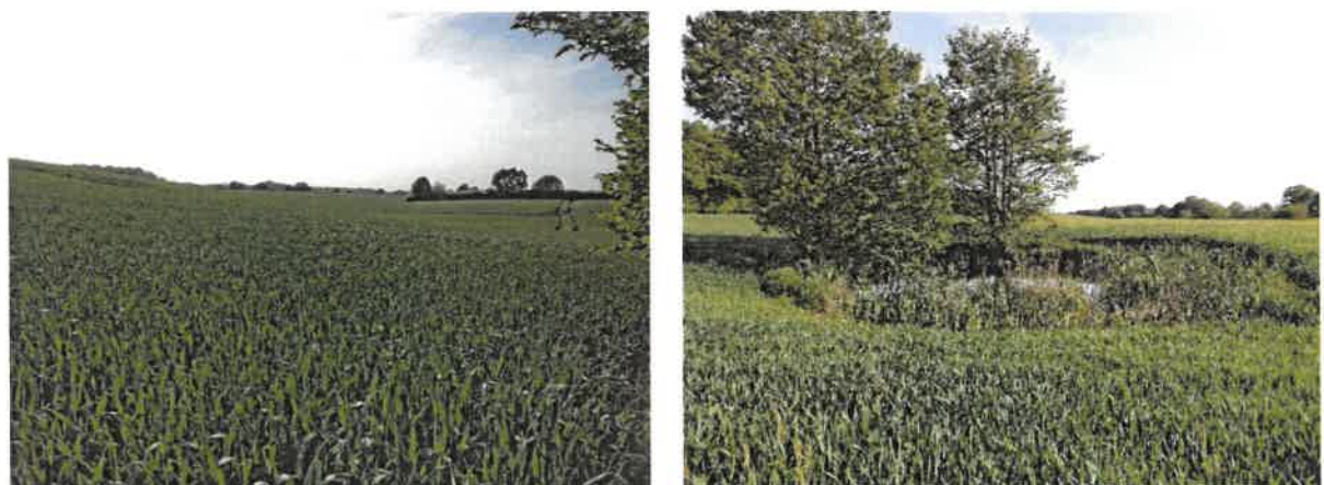
Abb. 3 Übersicht über die westliche Teilfläche des Vorhabengebietes. Links: Blick von Ost nach West über die Fläche. Rechts: Kleingewässer im Westen der Fläche. (Fotos: M. Liesenjohann, Juni 2023).