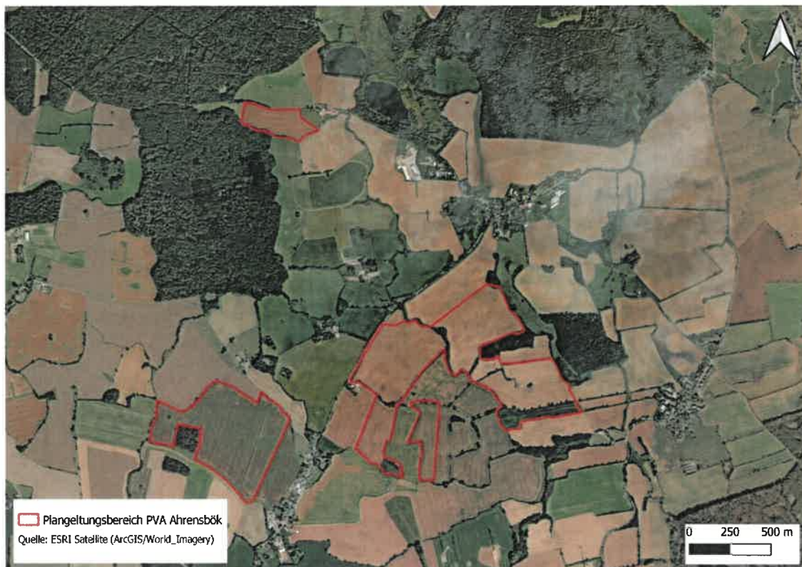
Abb. 1 Vorgesehene Flächen zur Errichtung der PVA Ahrensböck im Rahmen der 33. Änderung des Flächennutzungsplanes und der Aufstellung des Bebauungsplanes Nr. 83.

BIOCONSULT SH GMBH & CO. KG, Husum wurde durch greentech invest 7, Hamburg, beauftragt, eine Brutvogelkartierung für das Untersuchungsgebiet sowie eine Horstkartierung in den angrenzenden Waldbereichen (Umkreis 500 m) durchzuführen.