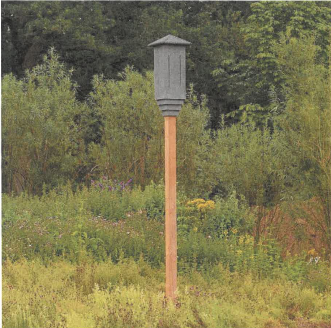
Abbildung 4: VK SK 04 Fledermaus Pfahlkasten Holzpfehl, auch bekannt als Fledermausrakete der Fa. Vivara Pro.

durch den direkt angrenzenden höhlenreichen Wald gemäß BNatSchG §44 (1) 3 weiterhin erfüllt ist.