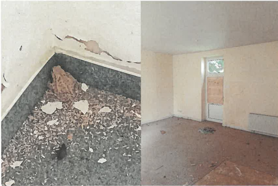
Abbildung 1: links: Erdkröte im Erdgeschoss des Gebäudes, die mit dem Verschließen der Fenster und Türen auf der Wiese ausgesetzt wurde. rechts: Eingangstür auf der Westseite des Gebäudes, Fenster war eingeworfen. Es wurde mit Brettern verschlossen