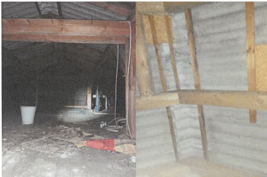
Abbildung 2: links: Dachboden, auf dem keine Spuren von Vogel-, Fledermaus- oder sonstiger Besatz gefunden wurde. rechts: Wellblechdach liegt direkt auf dem Dachstuhl auf, geringes Potenzial für Fledermäuse im Winter.