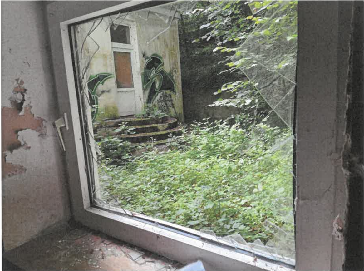
Abbildung 3: Eingeworfene Scheibe im Treppenhaus auf halber Höhe zum 1. Stock. Dieses Fenster wurde mit Brettern verschlossen.