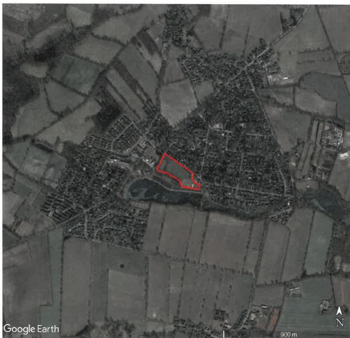
Abbildung 1: Untersuchungsgebiet (rote Linie im Zentrum) und 1 – km – Umfeld. Am Bildrand unten rechts der Umgriff des Vorhabens „Kita Bünningstedt“ (Luftbild aus Google-Earth™)