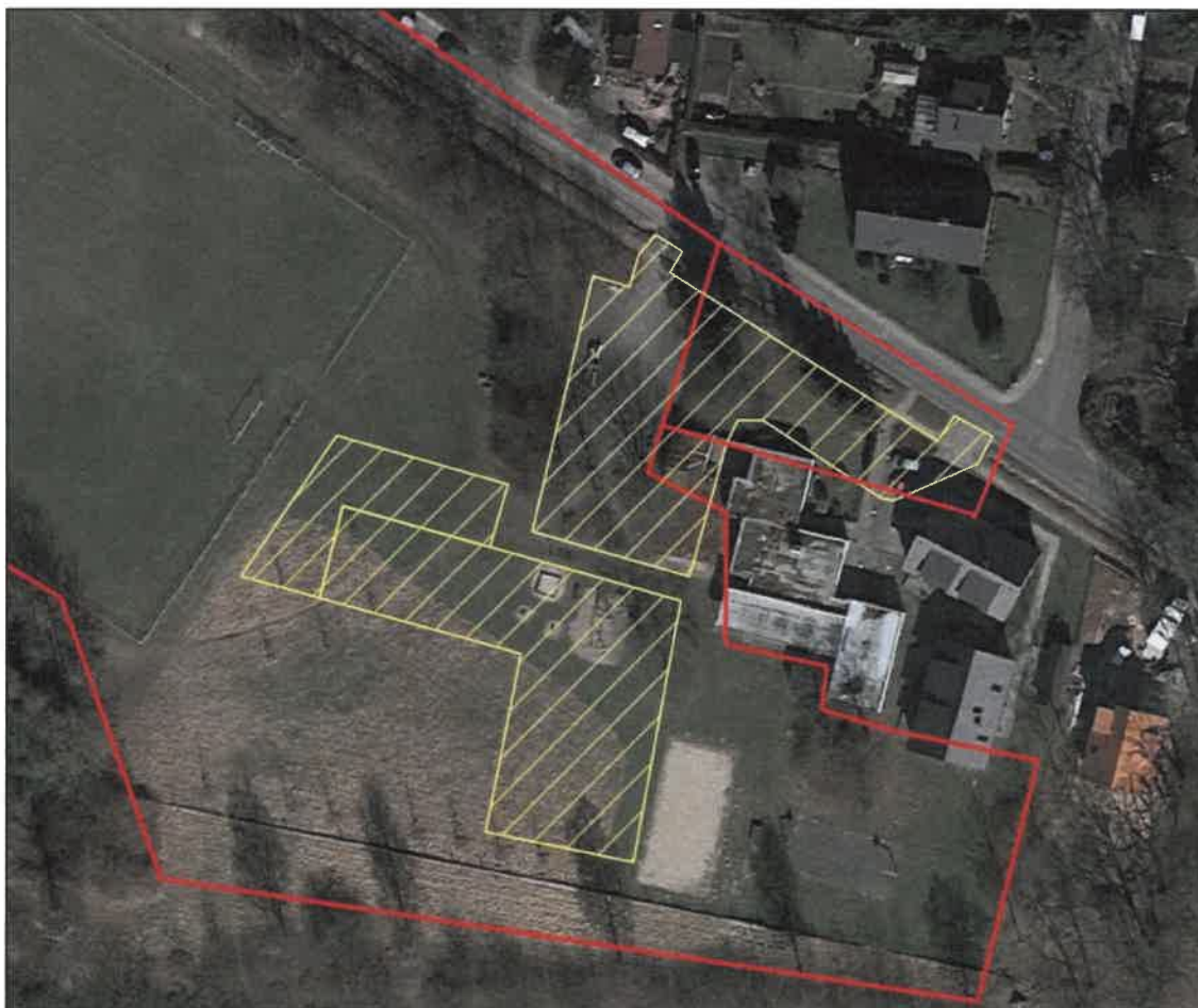
Abbildung 5: Planung im Luftbild aus Google-Earth™.

Zum Brutvogelschutz wird der eventuell zu entnehmende Gehölzbestand gemäß der allgemein gültigen Regelung des § 39 BNatSchG in der Zeit nach dem 30. September und vor dem 01. März beseitigt.