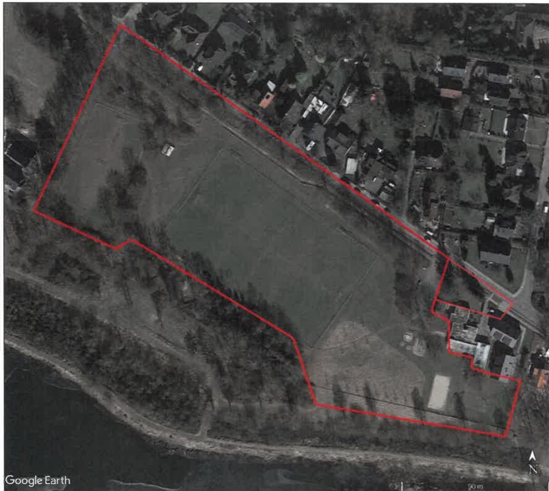
Abbildung 2: Untersuchungsgebiet (Luftbild aus Google - Earth™).