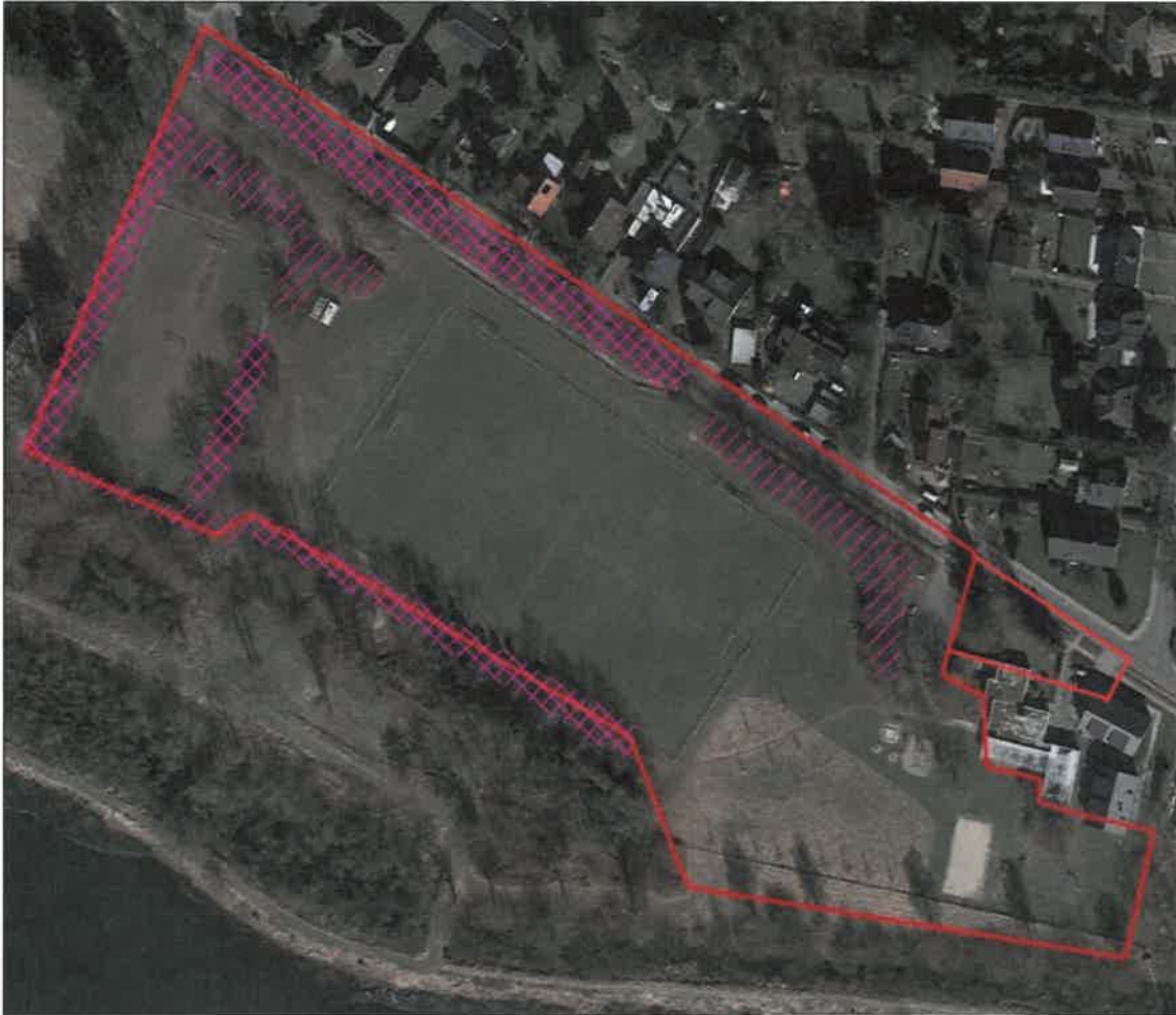
Abbildung 3: Lage der Gehölze mit potenziellen Fledermaus-Nahrungsräumen mittlerer Bedeutung (einfache Schraffur) und strukturreichen Bäumen mit Quartierpotenzial (Kreuzschraffur) (Luftbild aus Google-Earth™).

nete Höhlen. Alle übrigen Bäume sind noch relativ jung, befinden sich noch in der Wachstumsphase und weisen kein bzw. kaum Totholz auf.